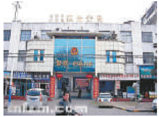
處在網絡舉報漩渦中的漢中市公安局漢台區分局

中國青年報社會調查中心去年10月進行的一項調查發現，75.5%的公眾最願意用「網絡曝光」參與反腐。本次調查也發現，78.3%的人認同，網絡舉報監督行為在預防或治理腐敗方面會發揮很大作用。