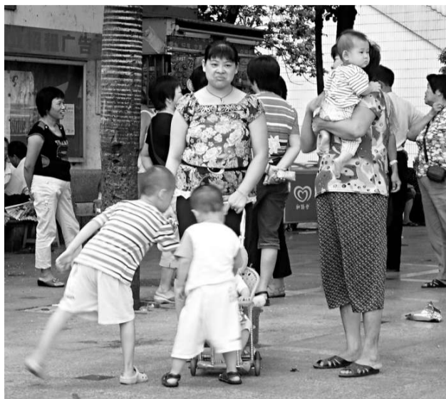
調查發現有近八成人表示如果政策允許，生兩個孩子是最理想的。圖為深圳的外來婦女為了下一代幸福，不惜犧牲自己寧願早生育

【本報訊】《中國青年報》社會調查中心日前的一項在線調查發現，在6183名受訪者當中，56.9%的人認為，只要條件具備就要趁早生育；但同時也有26.7%的人認為，30歲以後生育比較合適。此外，公眾認為最理想的生育年齡平均為27.6歲。此次調查中，就有1.6%的人表示自己不會要孩子。不過，近八成人（77.5%）表示，如果政策允許，生兩個孩子是最理想的。願意只生一個孩子的人為18.3%。