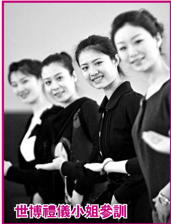
世博禮儀小姐參訓

上海世博會山東館禮儀接待人員25日在山東濟南進行形體訓練。參加培訓的18名候選禮儀人員均為在校大學生，在為期20天的培訓中，她們將接受形體、外事禮儀、世博會知識、外語等方面的訓練，最終確定16名禮儀人員赴上海世博會山東館從事引導、接待和講解工作。圖為參訓人員在進行訓練。（新華社）