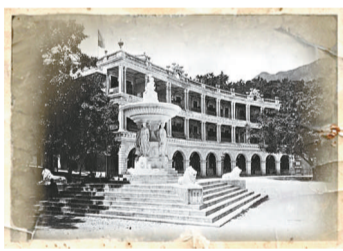
位於大會堂前的噴地噴泉，背景為大會堂對面的柏拱行，於1960年代拆卸