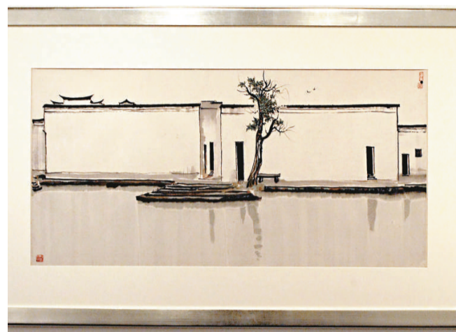
▲吳冠中視為最具代表性的作品《雙燕》