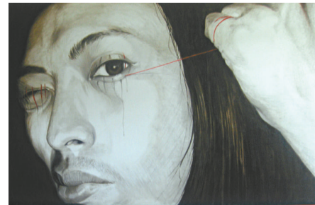
▲長澤郁美繪畫作品《I've got the key2》