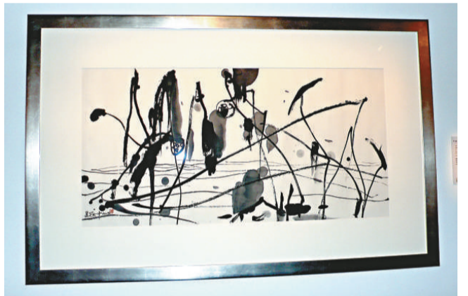
▲吳冠中二〇〇九年創作的《拋了年華》 ▲吳冠中二〇〇二年港公開寫生的作品《維港寫生》

吳冠中的畫作在市場有市有價，這批贈畫價值不菲，但沒有留給子女作為遺產，自二〇〇〇年以來，吳冠中把無私地向國家及海外多所重要的公共美術館捐贈畢生力作，並得到家人的支持。吳可雨表示：「父親一生追求藝術，當他從法國留學回到中國，遇到當時的政治環境下，他對藝術的追求受到壓抑及批判，不但不能畫畫，更要把畫作藏起來，但他仍堅持對藝術的探索。今天，他的藝術得到承認和有價值，但並沒有受商業社會影響他一向對藝術創作的堅持，他希望為人類創造藝術，他最希望是人人喜歡他的畫，他不希望作品只是被收藏家收起來，成為別人的財產，而是成為社會的財產，在藝術館裡可永久被收藏，被人所欣賞，也是他人生追求的願望。」