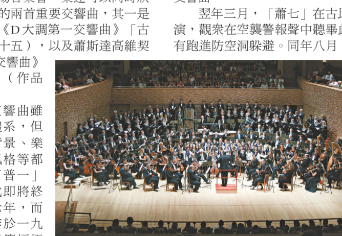
馬林斯基樂團將為今屆香港藝術節壓軸演出

至於另一場音樂會，樂迷可以同時欣賞到蘇俄體系的兩首重要交響曲，其一是普羅科菲耶夫《D大調第一交響曲》「古典」（作品二十五），以及蕭斯達高維契《C大調第七交響曲》「列寧格勒」（作品六十）。