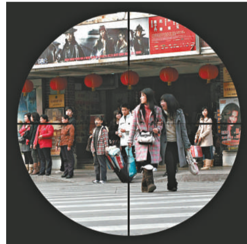
▲高銘研錄像《埋伏》 ▲南孝後作品《Deco Knife》

上世紀六十年代至今，世界不斷轉變，「八十後」身為戰後嬰兒潮後代的新生代，思想及價值觀跟父母輩很不同。他們不再為五斗米甘願妥協，相反，更懂得利用媒體及互聯網，向現實說「不！」——從個人利益出發，由居住及工作環境衍生的種種生活壓力開始，繼而關注社會發展及環境，並捍衛自我信念與理想。