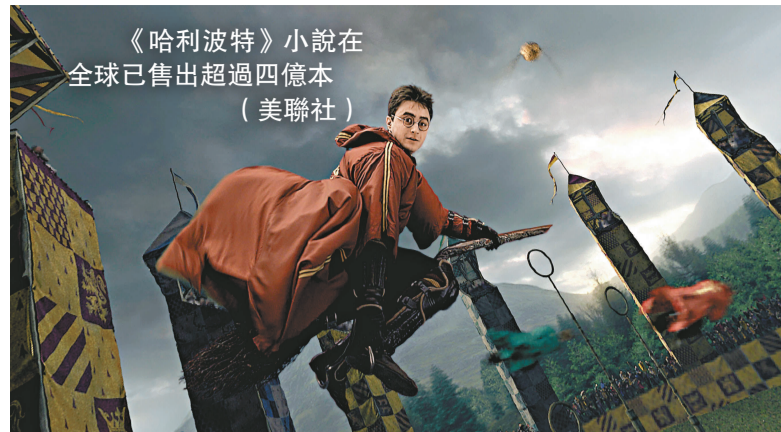
《哈利波特》小說在全球已售出超過四億本