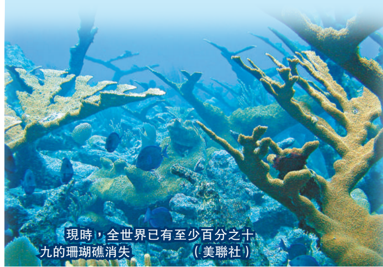
現時，全世界已有至少百分之十九的珊瑚礁消失