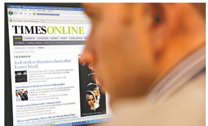
《泰晤士報》網絡版即將開始收費 (法新社)

《泰晤士報》主編哈丁把目前的新聞產業和四年前的音樂產業作了比較。他說，當時人們認為音樂產業完了，大家都在免費下載音樂，但是現在大家都在付費下載。