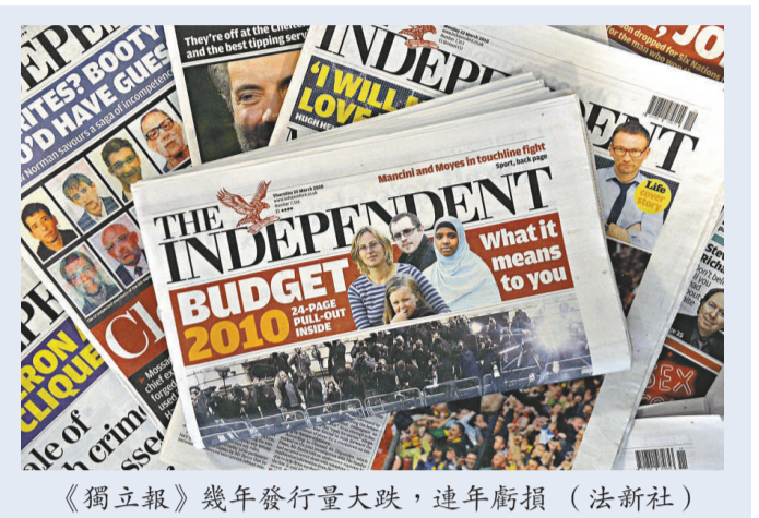
《獨立報》幾年發行量大跌，連年虧損

對於此次收購，《獨立報》所屬的獨立新聞傳媒集團(INM)表示，他們對《獨立報》和《星期日獨立報》被列別傑夫為今次收購而成立的獨立印刷有限公司(IPL)收歸旗下感到非常高興。IPL將獲得《獨立報》、《星期日獨立報》和相關網站www.independent.co.uk的所有產權。