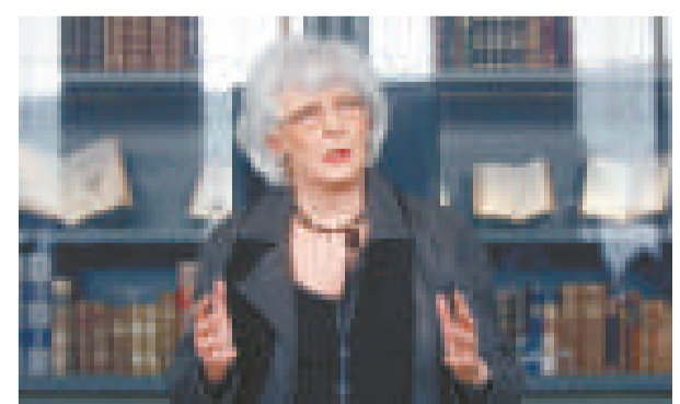
冰島歷史上首位女總理西於爾扎多蒂 (資料圖片)

可以說，冰島引領了世界追求男女平等運動的浪潮。而66歲的政治家西於爾扎多蒂成為冰島歷史上首位女總理也為這個國家的女權運動增添了更多的註腳，她還是第一位公開自己女同性戀身份的政治家。