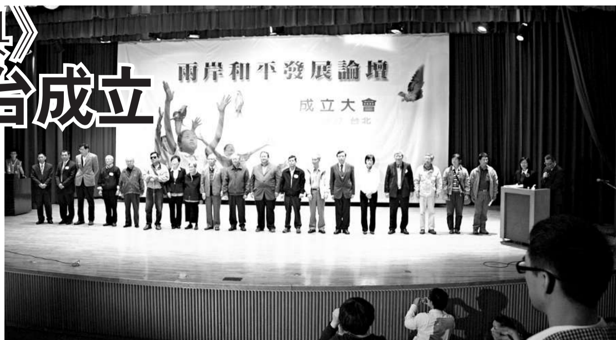
台灣各界、各民間團體近千人出席了「兩岸和平發展論壇」成立大會