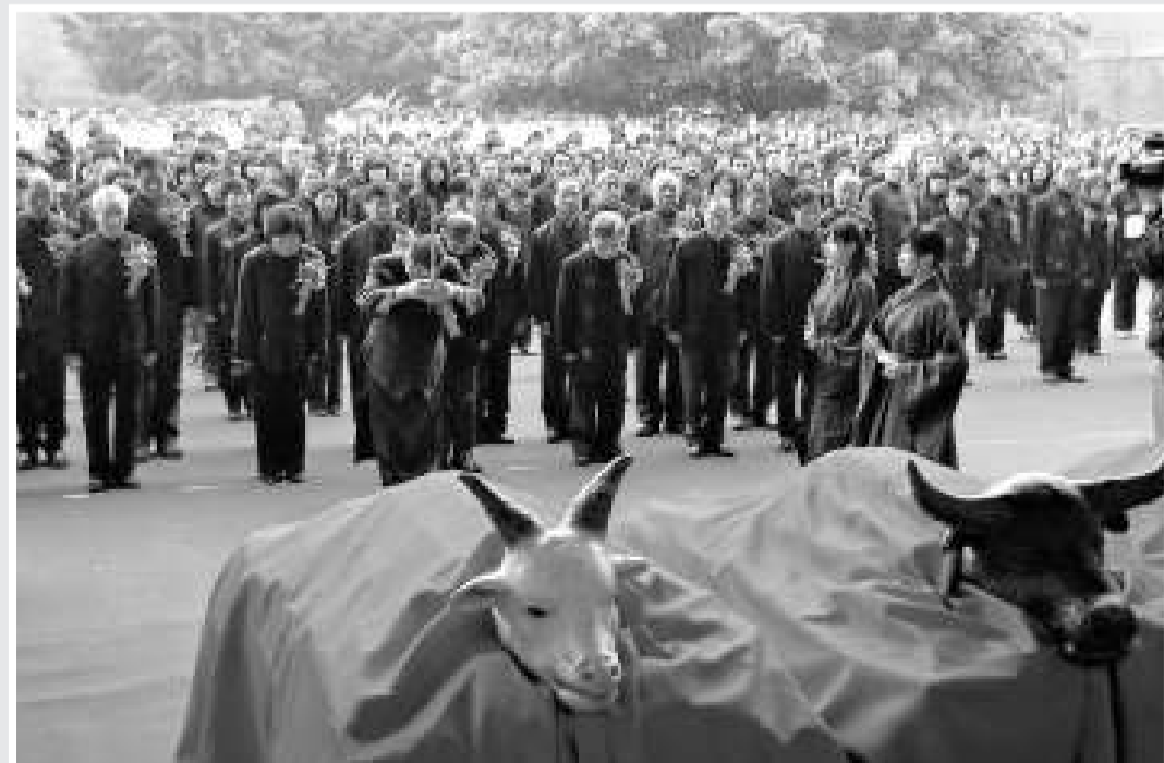
▲慶典禮制別有創意，用台灣傳統米糕做成的牛、羊、豬祭祀始祖

【本報記者黃仰鵬東莞二十七日電】廣東東莞台商子弟學校今天舉辦第六屆成年禮，慶典採用正統最高禮制「太平大禮」祭祀中華民族始祖，一百四十多名學生身穿明式儒生長袍參加授冠儀式並向父母及關心大陸台胞子弟教育的社會賢達跪拜道謝教育之恩。據透露，東莞台商校一年一度的成年禮已被廣東教育廳列為品德教育實踐品牌活動加以推廣，是次慶典特邀到香港、澳門、中山等兩岸三地逾百名學生及師長前往觀禮。