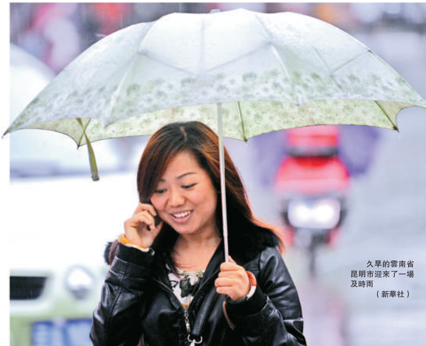
久旱的雲南省 昆明市迎來了一場及時雨 (新華社)

去年9月以來，雲南省絕大部分地區一直沒有降雨，目前部分地區旱情已達百年一遇，這給人民生活和春耕生產帶來嚴重困難。