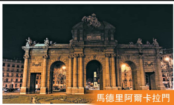
馬德里阿爾卡拉門