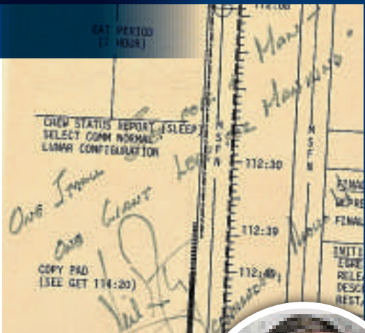
▲岩士唐在一份登月計劃上寫下自己著名的金句

岩士唐這句舉世聞名的話，真正想表達的涵義引發多年激辯。當年從月球傳回的聲音，地球上 5 億人都聽見岩士唐說，「One small step for man, One giant leap for mankind」。他似乎不小心漏掉句子中的「a」，讓這句話失去了原意。