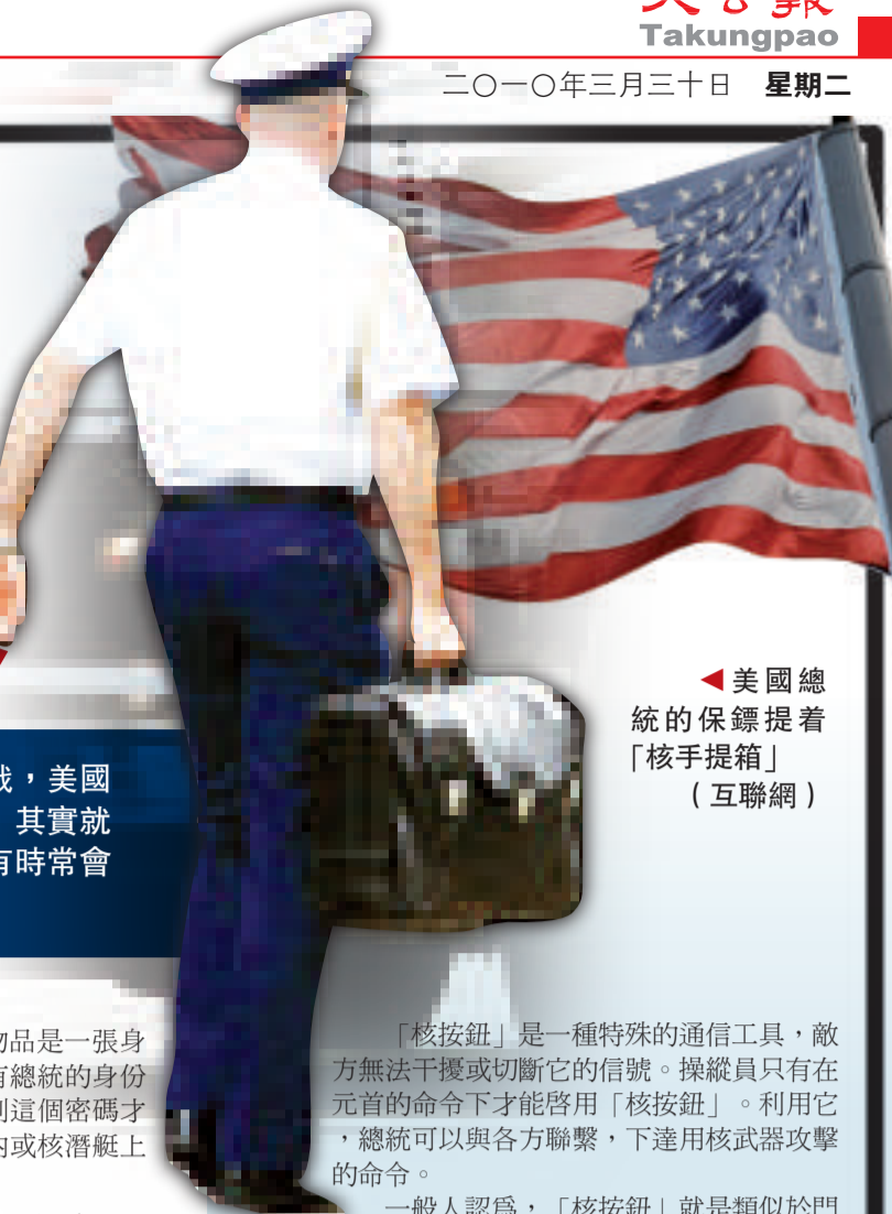
▲美國總統的保鏢提著「核手提箱」

【本報訊】綜合媒體二十八日報道：冷戰時期，美蘇關係緊張，為了防備核戰，美國總統會把傳說中的「核按鈕」放在一個黑色手提箱內隨身攜帶。所謂的「核按鈕」其實就是啟動美國核武器的密碼。但由於他們從來沒有機會使用「核按鈕」，美國總統有時常會把手提箱忘得一乾二淨，甚至把「核按鈕」和它的保鏢留在街上。