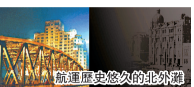
航運歷史悠久的北外灘

通過平台搭建和政策突破，集聚航運交易、金融保險、人才服務、信息服務、海事服務等要素，形成航運市場要素集聚、交易和優化配置中心，提高上海國際航運中心的影響力和輻射力。