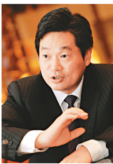
遂昌縣委書記葛學斌

遂昌縣委書記葛學斌表示，在生態文明興起的今天，作為浙江重要生態屏障地區的遂昌縣，惟有立足於縣情，依託山水這個最大資源、優勢和品牌，通過大力發展休閒旅遊業，把生態資源迅速轉化為發展優勢和經濟優勢，將休閒旅遊業培育成新的經濟增長點，全力建設長三角休閒旅遊名城，才能讓更多的人「樂在仙縣、富在遂昌」。