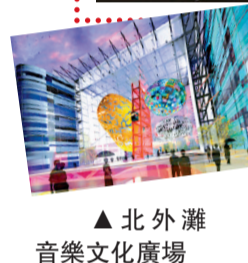
北外灘音樂文化廣場