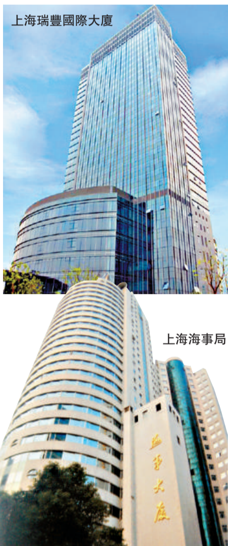
上海瑞豐國際大廈

北外灘開發建設規劃建築總量約570萬平方米，沿江地區近1平方公里的土地進入全面開發建設，已竣工建成100萬平方米商務商業，在建面積100萬平方米，未來五年還將開發150萬平方米左右，正逐漸成為上海吸引世界知名航運機構的重要載體。