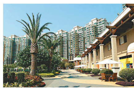
珀麗灣自發舉行每月「珀麗灣熄燈日」廣告燈箱改用LED燈、設置雨水收集器供平台花園使用，並設電動車充電站，鼓勵環保駕駛。

為支持環保及可持續發展，新鴻基地產（新地）連續第二年參與世界自然基金會的「地球一小時」全球熄燈活動，發動龐大網絡，團結旗下逾150項物業積極響應，於上周末晚上關燈一小時，其中包括：新鴻基中心、國際金融中心、中環廣場、apm、新世紀廣場及珀麗灣等，參與總數較去年增加一倍，成為參與數目最多的發展商之一，以實際行動展現環保決心。