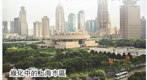
綠化中的上海市區