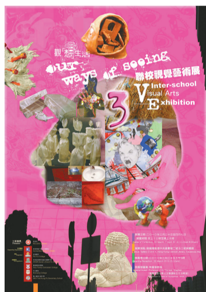
▲聯校視覺藝術展海報

參展學校以不同形式的藝術作品表達上述主題，其中包括繪畫、雕塑、陶藝、混合媒介、裝置、攝影、數碼圖像及電腦動畫等，從「觀」及「觀人、觀物及觀天地」出發，帶給觀眾新鮮的看法。展覽由即日起至4月7日在香港中央圖書館2號及3號展覽