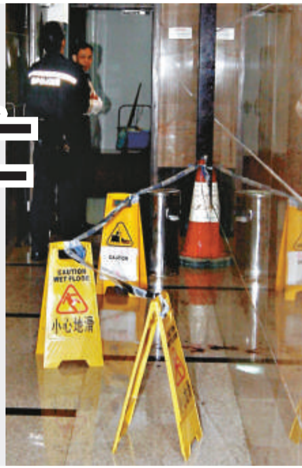
▶警員封鎖大廈現場進行調查

血流披面，負傷奪門而逃，滿身鮮血奔到樓下大堂向保安員求助，保安員見狀大驚，慌忙報警求助；差不多同一時間，男事主由大廈高處飛墮而下，跌落空地重創骨折昏迷，期間更因撞毀鄰層五層高大廈的外牆煤氣喉管，有煤氣洩漏。 警員趕到封鎖現場調查，女傷者由救護車送往東區醫院救治，送院時仍有知覺；救護員則證實墮樓男子已死亡毋須送院。由於有煤氣洩漏，消防員需開喉射水戒備以防爆炸。警員上樓調查，發現單位染有血漬，初步懷疑有人傷人後畏罪，走到二十六樓天台躍下自殺，並在兩廈之間的後巷，檢到一頂帽，估計是男子墮樓時飛脫。案件由東區重案組探員接手，現場檢獲一柄染血鐵鎚，懷疑是涉案兇器，已檢走作為證物。