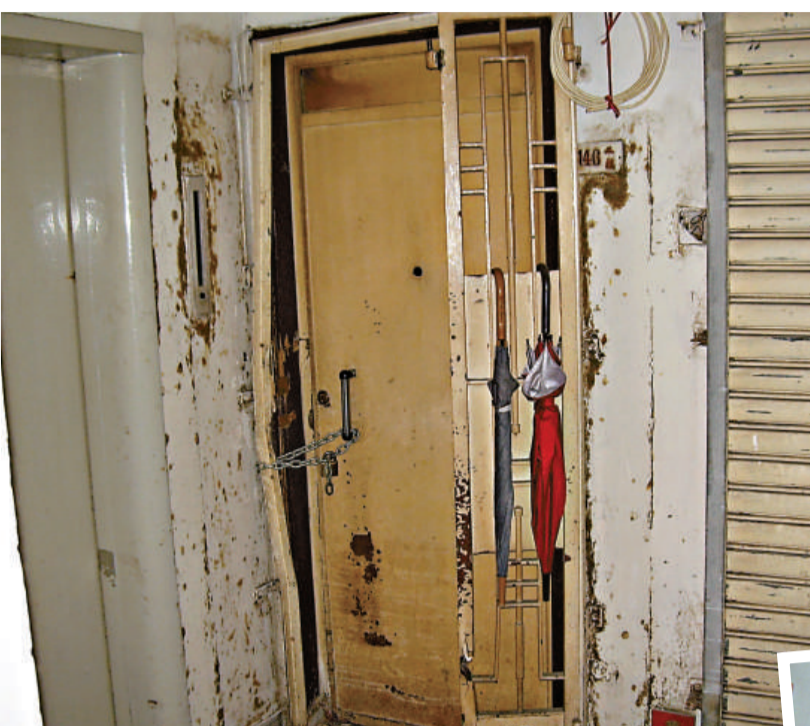
▶遭封屋「釘契」的單位