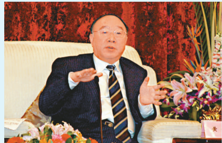
重慶市市長黃奇帆接受香港媒體高層集團採訪

他對自己評價比較低調：「我自己應該是一個技術官僚、經濟運行的操盤手，對資本的運作、對處理各種經濟『疑難雜症』我比較有經驗，碰上問題我也從不膽怯，迎頭而上。所以我認為熙來書記的