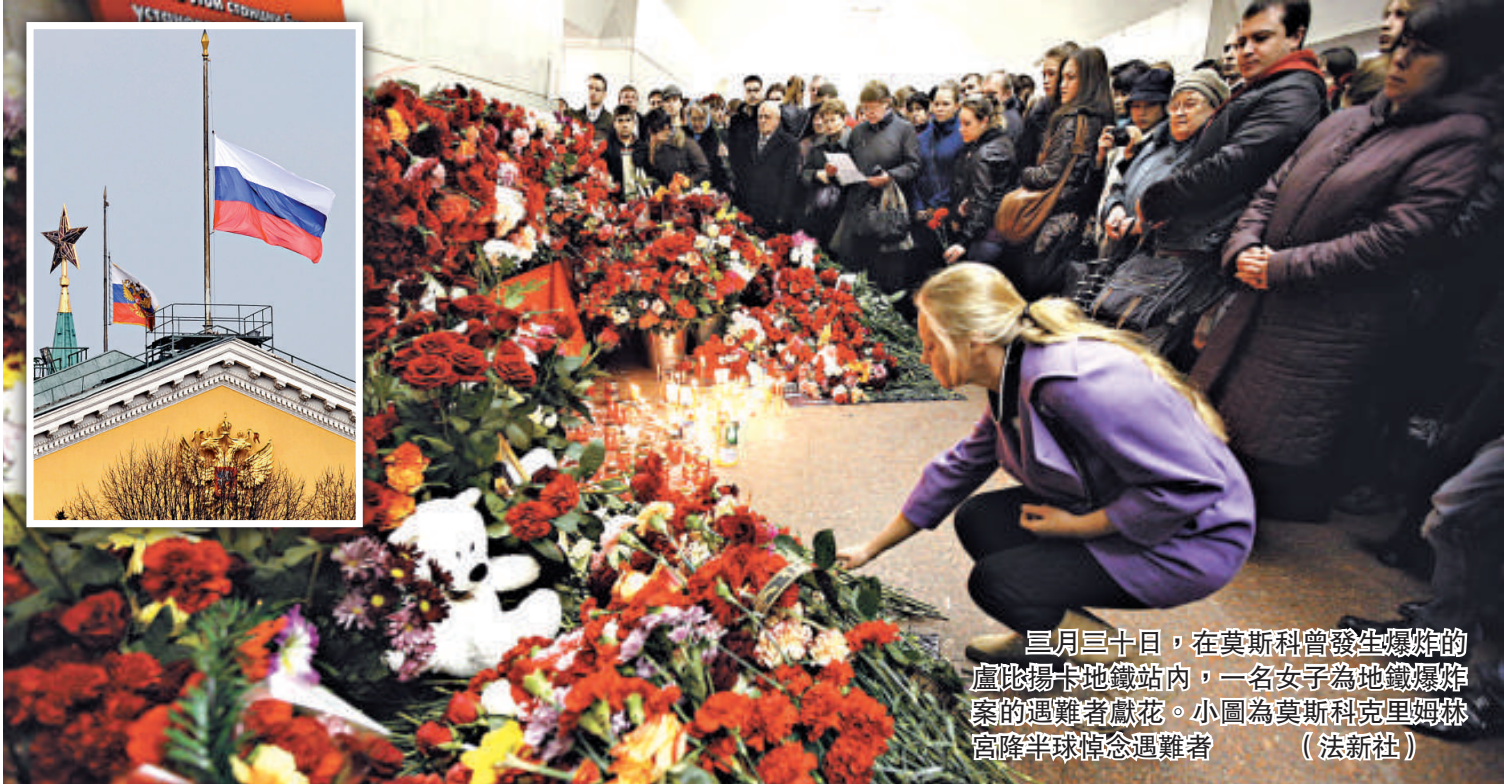
三月三十日，在莫斯科曾發生爆炸的盧比揚卡地鐵站內，一名女子為地鐵爆炸案的遇難者獻花。小圖為莫斯科克里姆林宮降半旗悼念遇難者