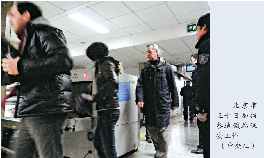
北京市三十日加強各地鐵站保安工作（中央社）

【本報訊】據中通社北京三十日消息：莫斯科地鐵站二十九日相繼發生兩起恐怖襲擊後，北京警方連夜部署，升級安檢措施，軌道交通將嚴格執行「逢包必檢，液體必查」，同時增加警犬數量，在地鐵站內增加民警攜犬巡邏。