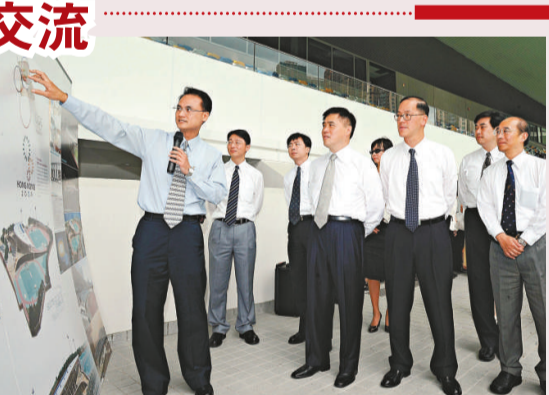
▲曾德成陪同台北市市長郝龍斌參觀將軍澳運動場（資料照片）