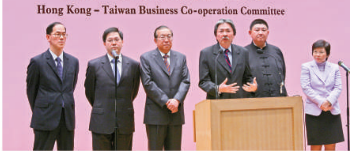
▲香港成立新溝通平台推動港台兩地交流。財政司司長曾俊華（右三）、港台經濟文化合作協進會主席李業廣（左三）、香港一台灣商貿合作委員會主席李大壯（右二）、政制及內地事務局局長林瑞麟（左二）、民政事務局長曾德成（左一）和商務及經濟發展局局長劉吳惠蘭（右一）在新聞發布會上

香港 - 台灣商貿合作委員會 Hong Kong - Taiwan Business Co-operation Committee