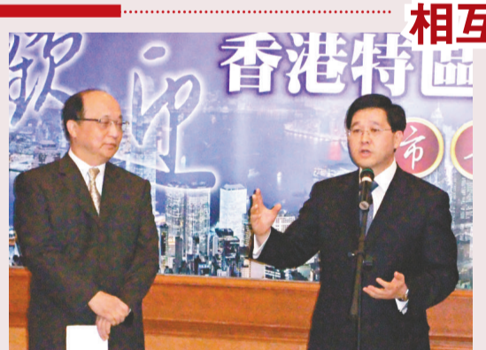
▲林瑞麟（右）早前訪問台中，市長胡志強熱情接待（資料照片）

另外，香港貿發局將為「委員會」擔任秘書處的職務，對「協進會」的成立表示歡迎，認為對促進港台之間多方面往來和合作有莫大的幫助。