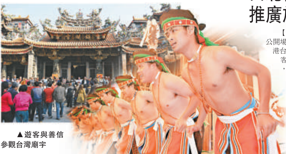
▲遊客與善信參觀台灣廟宇

田北俊說，透過「協進會」制訂更高層次的政策，有助改善兩地的整體交流。不過，旅發局現時在台灣已有代理機構作推廣工作，未必需要等「協進會」提出政策指引。他表示，今年首季台灣訪港旅客人數約有一成增長，但仍未回復「三通」前的水平。