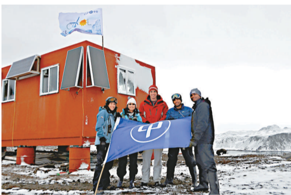
可再生能源設備經過五天的搶修，終於恢復電力供應。

極，展開「極酷行動」。為幫助非政府組織「2041」恢復當地教育基地的電力，他們共攜帶了兩百公斤重的行李，單是三塊太陽能板，已重達六十公斤。