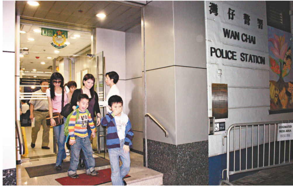
昨日傍晚近60名苦主到灣仔警署報案，希望向突然結業的瑜伽中心追討責任。