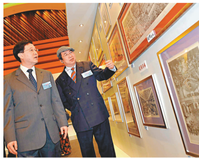
《世博百年》珍藏展於德福廣場舉行，政制及內地事務局局長林瑞麟（左）亦到場參觀。

【本報訊】世博進入倒數三十日之際，「香港各界支持上海世博聯合會」與德福廣場合辦《世博百年德福廣場光速遊》珍藏展，從本月一日至十二日，展出歷年世博銅板畫和限量紀念品，總價值八百多萬元，為港人提前帶來世博氣氛；同時，香港參與上海世博的流動電話版網站也正式啓