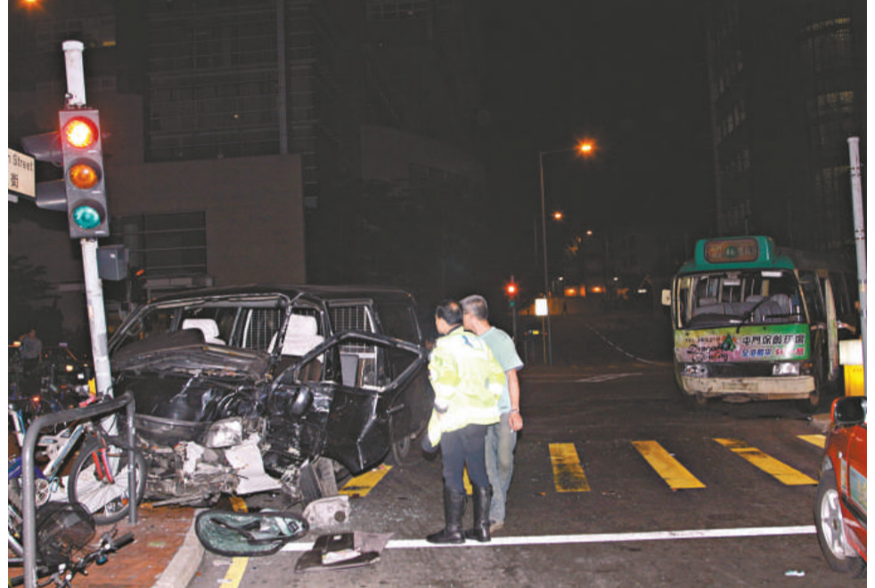
▲屯門震寰路發生小巴與客貨車相撞意外現場

客貨車司機和一名男乘客頭手腳受傷，其中乘客被困無法爬出，需消防員接報到場，撬開客貨車車門救出；小巴有司機及三名女乘客受輕傷，僥倖有驚無險，驚魂甫定後陸續自行走出車廂。全部傷者由救護車送到屯門醫院治理，警方目前仍在調查車禍原因。