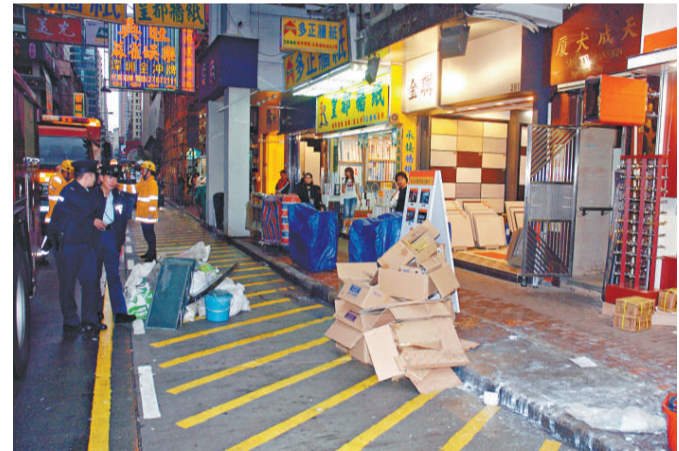
▲旺角砵蘭街發生鎊水彈驚魂事件，警員到場調查證實虛驚一場