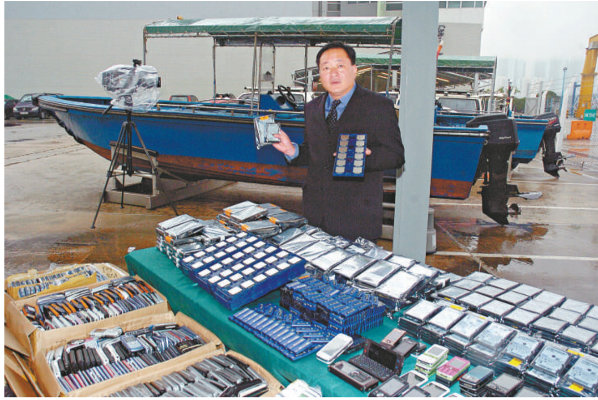
▲海關截走私快艇，檢逾300萬電子貨品，拘捕兩名男子

由於兩艇艙面空空如也並無貨物，兩名船家表現得神色鎮定，並回答稱準備前往南澳維修。海關人員鏗而不捨仔細檢查，終於在油缸底發現暗藏機關，在兩艇上共搜出三十八箱電子貨物，包三千餘部電腦硬碟、近六千部二手電話、大批電腦USB手指等，總值三百三十萬元，以懷疑走私罪，將兩漢連同貨物帶返總部扣查。