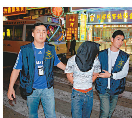
▲涉以「朱義盛」騙當舖，內地漢被押回現場調查

贓並獲。調查期間，警員在疑人身上發現一批「朱義盛」鑽飾。有人承認在內地購入「朱義盛」鑽飾，作為來澳詐騙押店或珠寶行之用，警方相信疑人涉及去年六月起至今多宗同類型案件。警方聯絡有關受騙的押店或珠寶行，確定疑人至少與去年六月二十二日及本年一月二十日的三宗案件有關，以及一批疑用作行騙押店的「朱義盛」。警方調查後相信疑人與多宗押店及珠寶行被騙案件有關，涉及金額近六十萬。