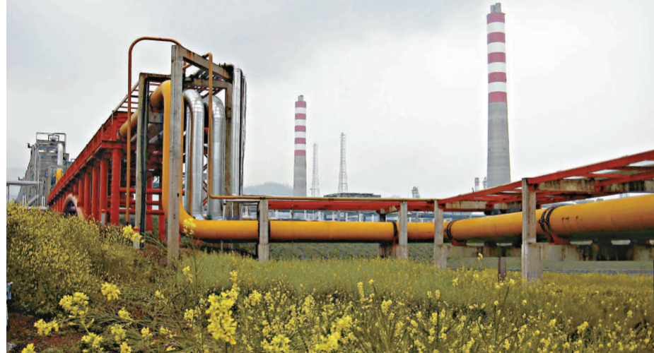
近日，由中石化投資建設和運營的國家「十一五」規劃重大項目——川氣東送工程建成投產。川氣東送工程是我國繼西氣東輸工程後又一項宏大工程。圖為川氣東送工程起點四川省達州市宣漢縣普光氣田天然氣淨化廠輸氣管道網

【本報訊】2010年，新疆將建石油戰略儲備與商業儲備工程，預計該工程儲存石油總庫容達1300萬立方米。目前，該工程正在獨山子和鄯善等地加緊實施，項目在2010年建成後將提升新疆煉化企業抵禦市場風險的能力。