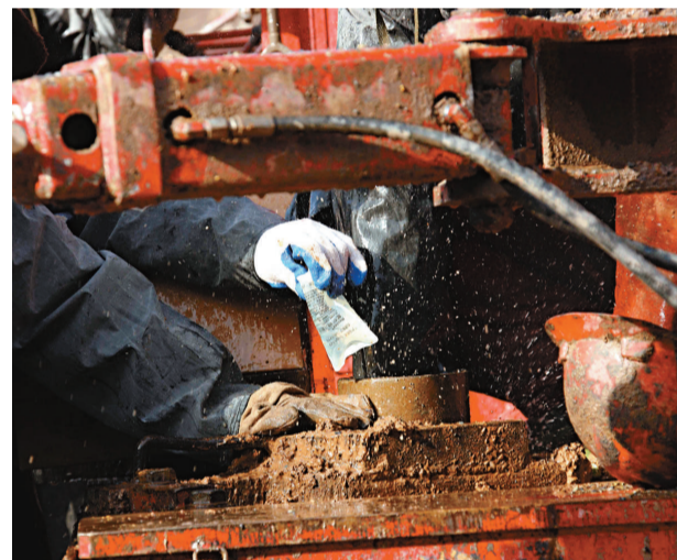
二日，救援人員正在把軟包裝葡萄糖注射液塞進鑽桿裡送往井下

一封寫道：親愛的工友們：中共中央、國務院和全國人民時刻都在關注你們的安危；省委、省政府領導正在現場指揮搶險工作。人們都為你們傳遞的生命的信息萬分高興，都在爭分奪秒、全力以赴救人。你們一定要堅定信心，堅持到底！堅持就是勝利！