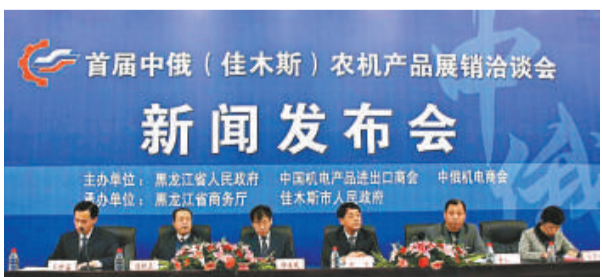
首屆中俄（佳木斯）農機產品展銷洽談會新聞發布會（本報攝）

【本報記者于海江哈爾濱二日電】為促進中俄貿易發展，搭建共同合作平台，推動中俄農機產品貿易戰略調整，優化區域農機發展，首屆中俄（佳木斯）農機產品展銷洽談會將於4月10日召開。