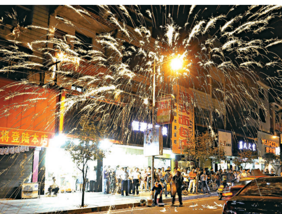
▲拋向50米高空的「鐵水」如同煙花四射

對此，攸縣文化館有關領導表示，為了保護傳統文化，近幾年攸縣文化館「非遺」項目小組對此進行了搶救性保護，目前，「打鐵水」已列入有關方面「非遺」保護項目，並確定每年中秋節晚上為「打鐵水」表演日。今後，還將在春節期間擴大這一表演，讓更多人知道中國民間文化的真諦。同時，由政府拿出專項資金，鼓勵年輕人專項學習，繼承收縣這一傳承了數百年的民間文化絕技。