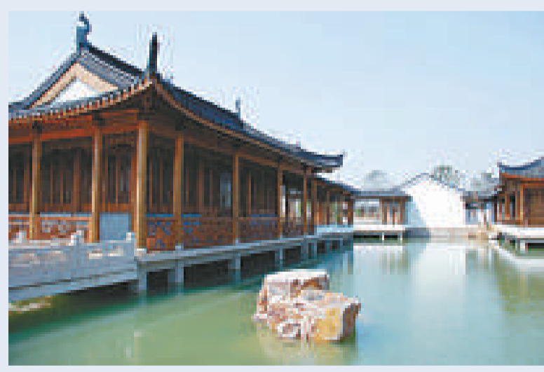
▲拂水山莊一角 (網絡圖片)