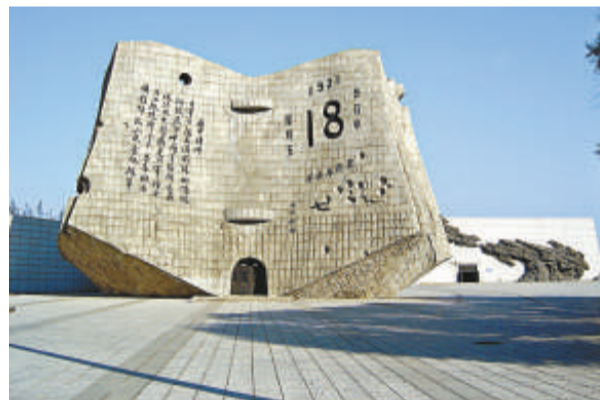
瀋陽「九一八」紀念碑