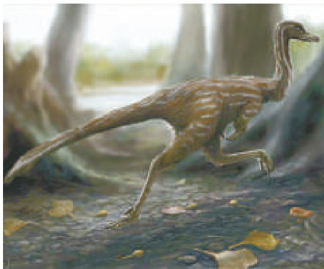
張氏西峡爪龍的想像圖 (網絡圖片)