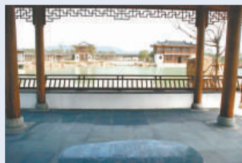
▲水閣曲廊眺望湖色天光 (網絡圖片)