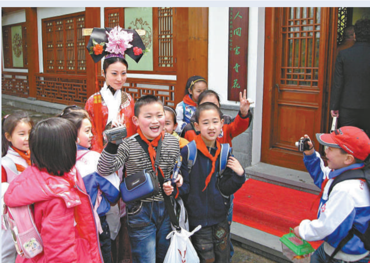
▲江蘇常熟尚湖正舉行牡丹花會，花會上舉辦的「牡丹仙子」評選，吸引了許多好奇的小朋友

重修後的「拂水山莊」，曲廊迴繞，粉牆黛瓦，亭台樓閣，錯落有致，四水環抱，遠望如同漂浮在如煙雲水之間。為「十里虞山半入城」常熟名城增添了一道古典婉約的風景線。