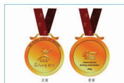
▲中國拳擊公開賽獎牌之一

另外，賽事還設置了特別獎項，其中最高榮譽獎、最佳技術獎將授予金盤，榮譽獎、技術獎將授予銀盤。獎盤直徑30厘米，金盤製作是在純銀上覆蓋50克純金，正面周圍是中國苗族圖騰「吉