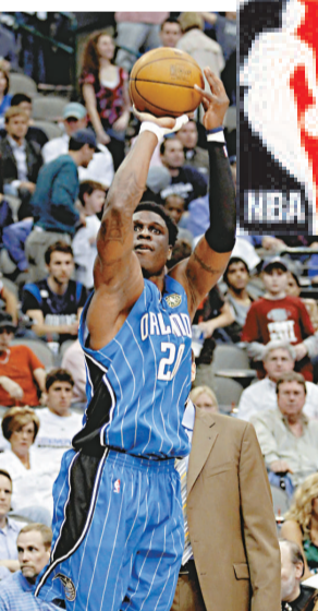
▲比杜斯為魔術告捷立大功

【本報訊】綜合外電美國，達拉斯二日消息：NBA東、西岸兩支勁旅周四正面交鋒，西岸的小牛坐鎮主場以82：97不敵東岸的魔術，將西岸第2的位置拱手相讓予爵士。