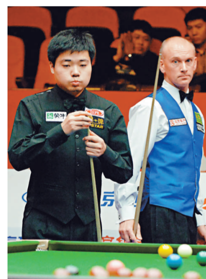
▲丁俊暉（左）以5：2戰勝艾比頓（右），晉級準決賽

晚上的半準決賽，號稱「金左手」的威廉斯令傅家俊整場比賽沒有太多進攻機會，先勝2局的威廉斯在第3局更以單桿116分讓傅家俊「吃蛋」，休息前傅家俊扳回1局，仍難阻2屆中國公開賽盟主威廉斯以局數5：1取勝，威廉斯在4強的對手會是英格蘭人卡達。