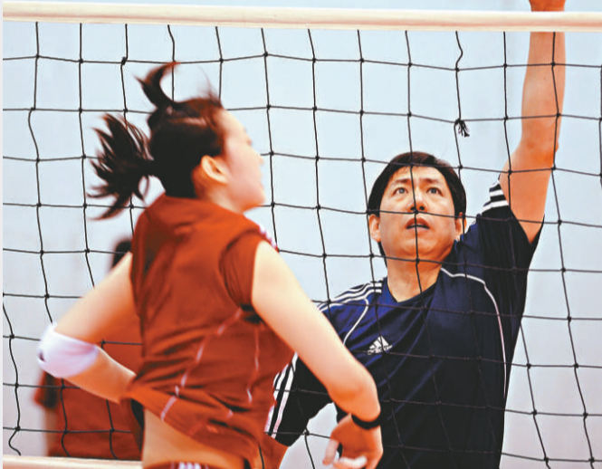
▲中國女排姑娘們在主教練王寶泉（右）率領下苦練基本功

新一屆中國女排是於3月底組建完成，3月28日即赴漳州訓練基地開展為期兩個月的集訓。4月1日和2日是對媒體公開訓練日，其餘時間全部為封閉訓練。