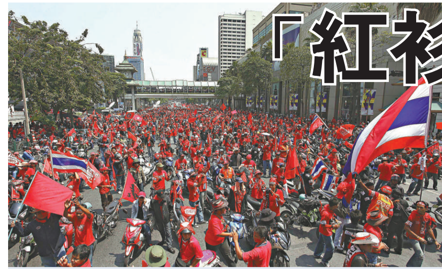
泰國「紅衫軍」連續第四個周末在首都曼谷遊行示威，佔據市中心商業區、四面佛附近多條道路