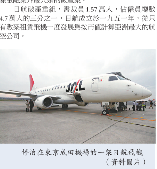
停泊在東京成田機場的一架日航飛機 (資料圖片)

日航破產重組，需裁員 1.57 萬人，佔僱員總數 4.7 萬人的三分之一，日航成立於一九五一年，從只有數架租賃飛機一度發展為按市值計算亞洲最大的航空公司。