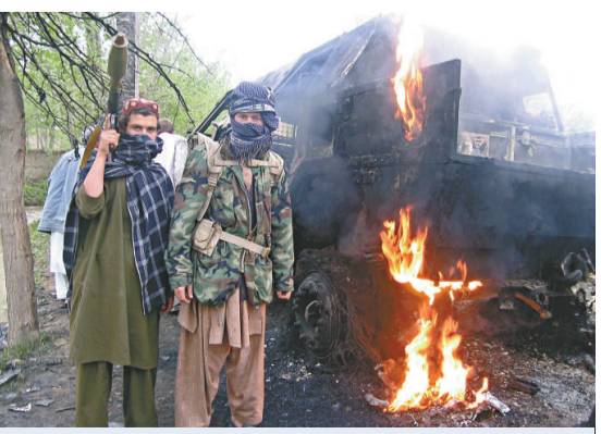
塔利班武裝分子站在被焚毀的德軍車輛前

目前駐紮在阿富汗的北約部隊中大約有四千三百名德國軍人，主要駐紮在包括昆都茲省在內的阿富汗北方諸省。