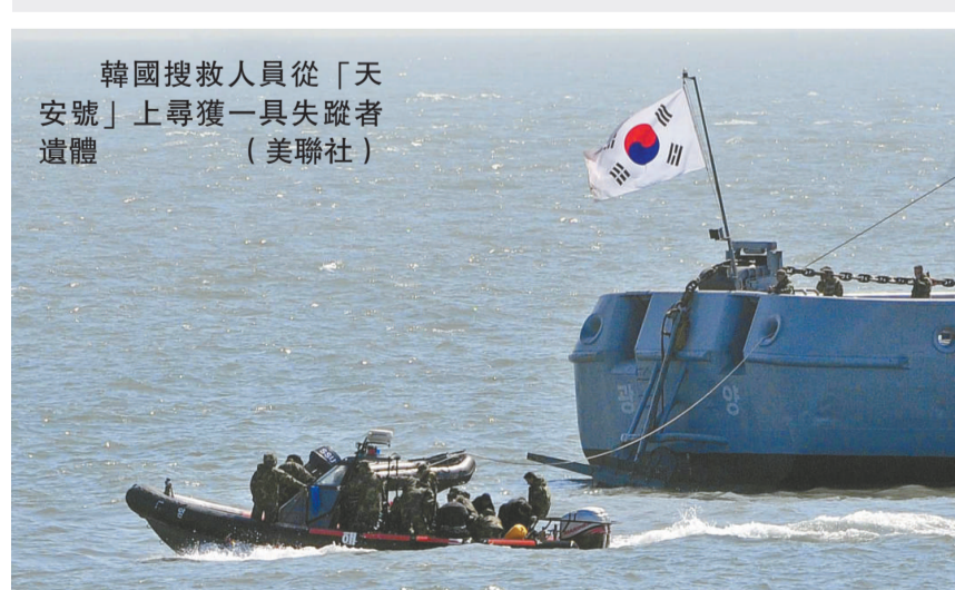
韓國搜救人員從「天安號」上尋獲一具失蹤者遺體

【本報訊】據韓國聯合通訊社三日消息：韓國海警三日透露，一艘參與搜救「天安號」巡邏艦的漁船沉沒，目前已確認一名船員死亡，八人仍然下落不明。同日，搜救人員還從「天安號」上尋獲一具失蹤者遺體。