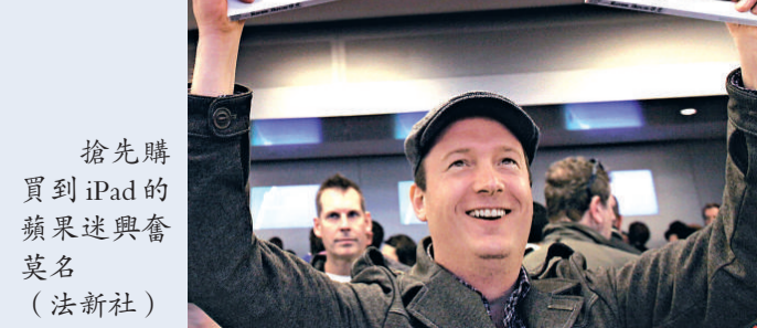
搶先購買到 iPad 的蘋果迷興奮莫名

另外，許多主流消費者較青睞 3G 版本 iPad，因此傾向等到四月底再買。星期六上市的基本款，只能透過 Wi-Fi 來上網。而同時擁有筆電與智慧手機的重度科技用戶，則認為 iPad 的功能不敷使用，因此沒必要搶着添購。