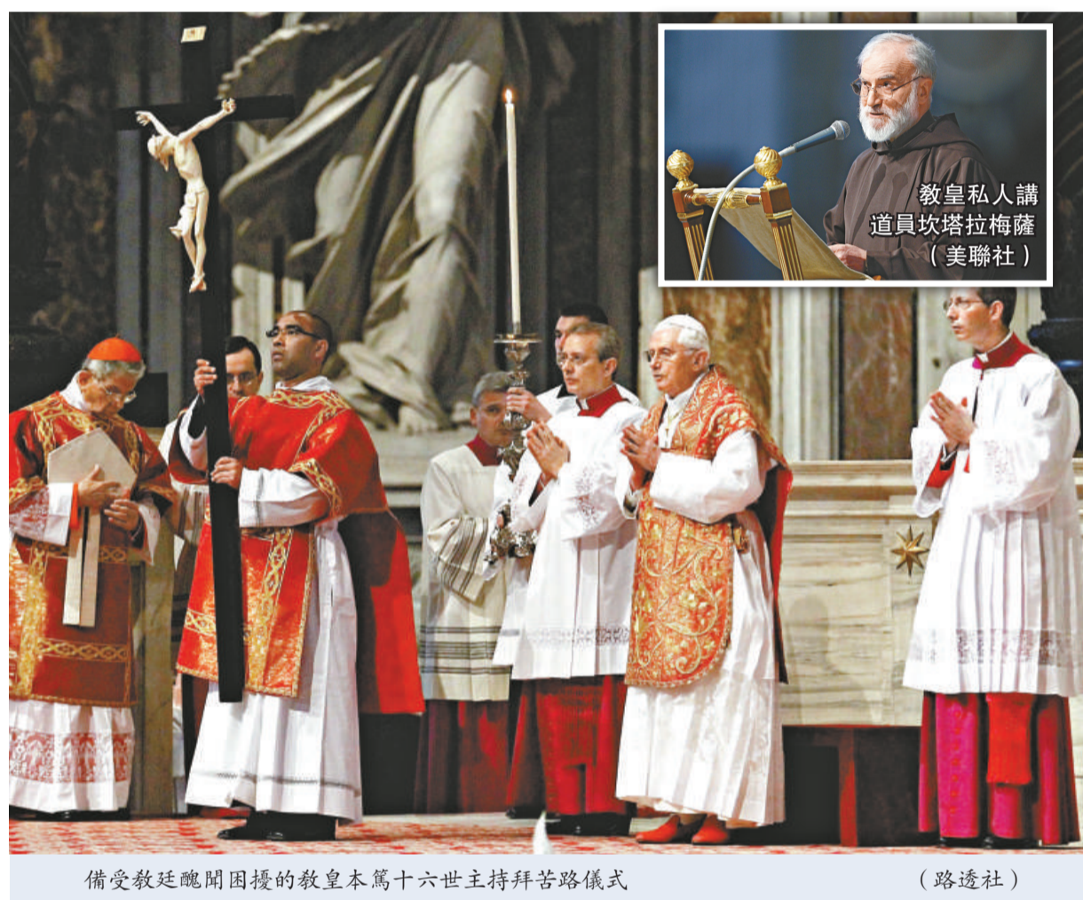
備受教廷醜聞困擾的教皇本篤十六世主持拜苦路儀式