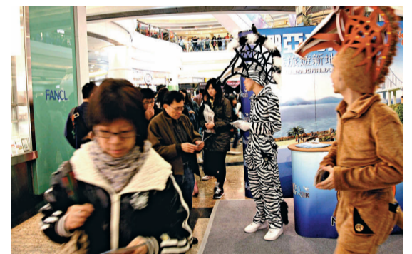
▲昨日為復活節長假第二天，有穿上特別服飾的宣傳人員在商場推介香港特色景點

對於今年經濟好轉，加上世博及高鐵通車的幫助，令本港旅遊業出現小陽春。田北俊在另一個電台節目中表示，初步數字顯示，今年首季旅客人數較去年同期上升約一成半。他對今年旅遊業市況樂觀：「如無太大外圍因素轉變，全年訪港旅客相信可以打破三千一百萬人次大關。」他說，外國不少政府的退市行動將帶來一定影響，加上失業率仍高企，亞洲又有個個大型景點落成競爭加劇，旅遊局將會密切留意下半年情況，有需要時調整推廣計劃。