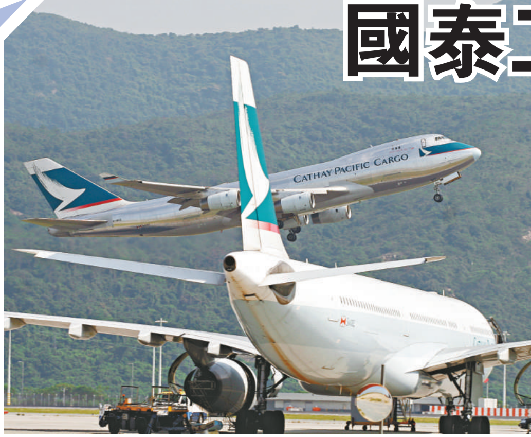
▲國泰航空發表聲明稱管理層將與工會提前恢復談判，但工會卻堅拒在今日重返談判桌