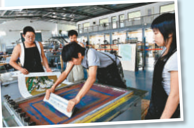
▲技師創作版畫 ▼具有中國田園風光特色和300年客家文化底蘊的觀瀾版畫基地

記者來此探訪是早春的一個午後，天空蔚藍、陽光明媚，青磚碎瓦鋪就的石板路旁，60多幢獨立的磚瓦房裡對應着不同版畫家的工作室。藝術愛好者三三兩兩、悠然踱步，輕叩門扉，每一家畫廊就是一個部落，主人的作品懸掛在四周牆壁上，那些版畫中看似簡單樸素的線條彷彿可以剝落層層的記憶，以一種緩慢的優雅，牽引着觀者探尋或熟悉或陌生的歷史。