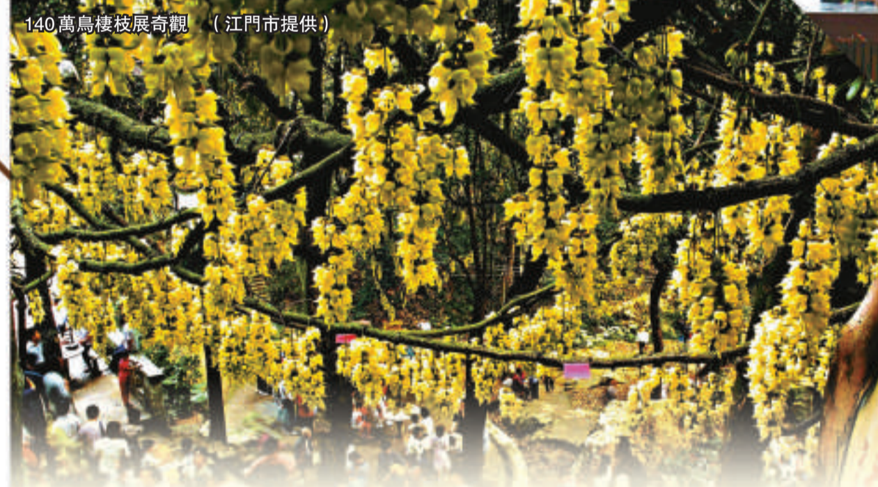
140萬鳥棲枝展奇觀