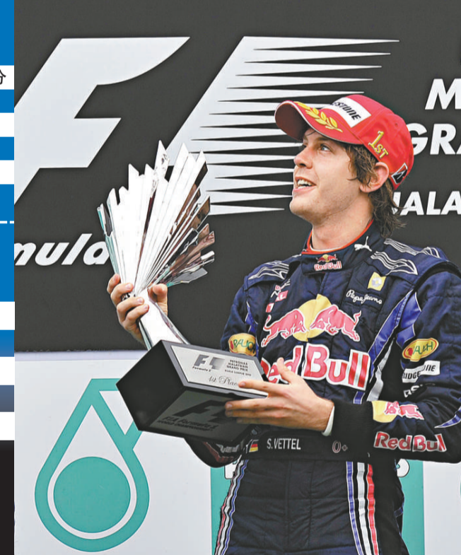
▶維特爾在馬來西亞站稱王（法新社）