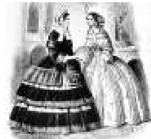
▲維多利亞時期女子裝扮 (資料圖片)

昔日在美國威斯康星大學及加州史丹福大學工作的莫舍，從未有把她那份美國女性調查結果發表出來。她一九四〇年去世，她的問卷也留存在史丹福的檔案庫一個沒有標記的檔案裡被人遺忘，直至一九七三年才由一名歷史學家偶然發現，如今更透過《史丹福雜誌》一篇文章引起公眾廣泛注意。