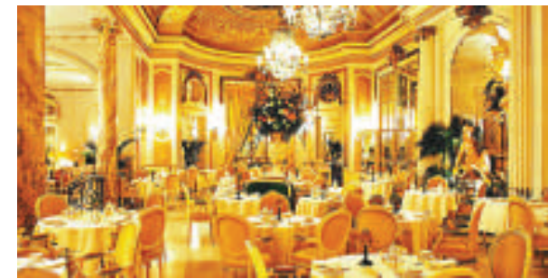
▲倫敦麗茲酒店以豪華著稱 (資料圖片)

除了巴黎之外，在比利時首都布魯塞爾的皇家鑄幣局劇院廣場、美國紐約的聯合國廣場，以及阿根廷首都布宜諾斯艾利斯，眾多的枕頭戰愛好者也帶着大大小小的枕頭，來重溫自己兒時的回憶。