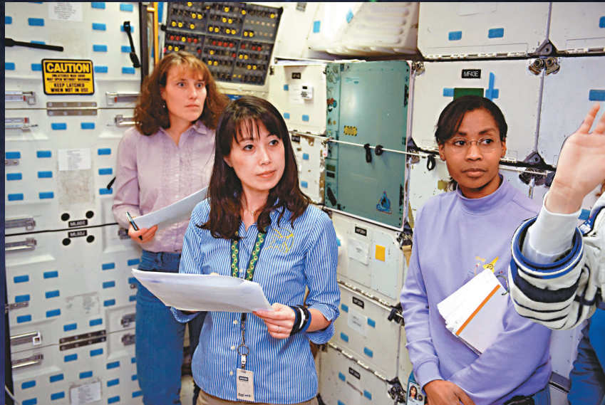
▲自左向右依次為林登貝爾格、山崎直子和史特凡妮·威爾遜 ▶美國女太空人特蕾西·考德威爾·戴森