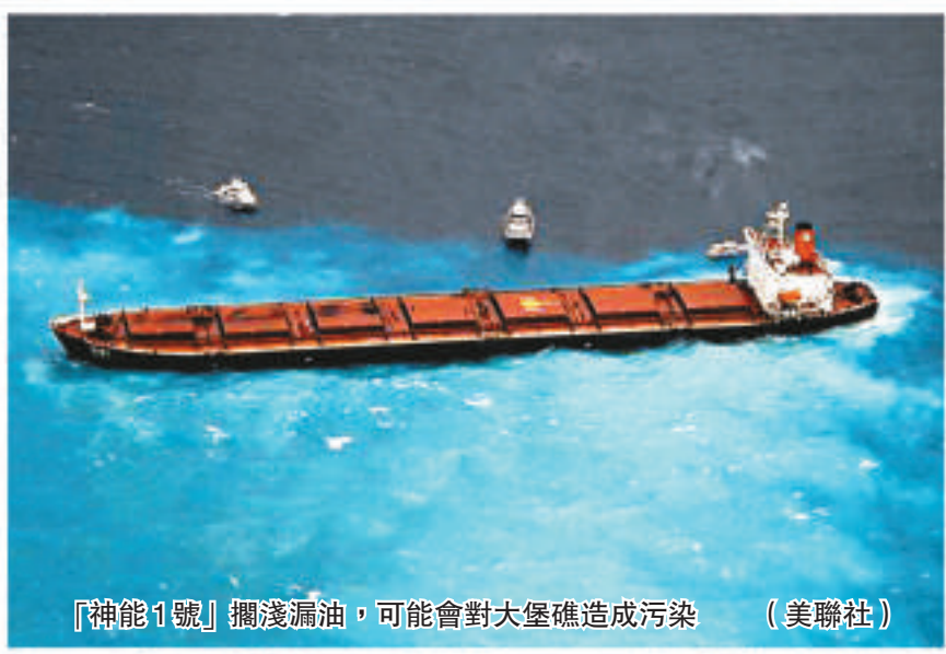
「神能1號」擱淺漏油，可能會對大堡礁造成污染（美聯社）