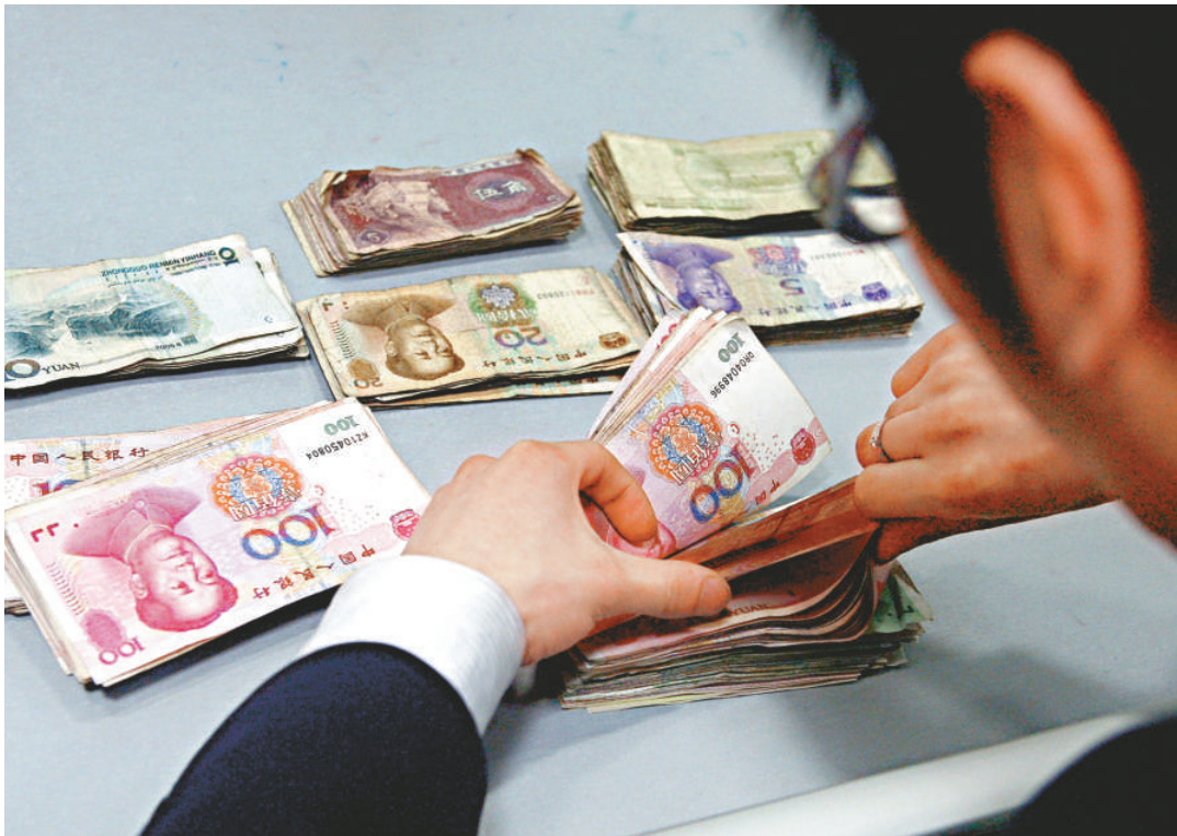
美國白宮表示，押後公布關於中國是否貨幣操控國的報告。圖為中國的銀行職員正在工作（路透社）

此間分析稱，奧巴馬政府有意通過此舉，為胡錦濤來美出席核安全峰會以及爭取中國在包括伊朗核問題在內的國際事務中合作營造良好的氣氛，同時掃除了中國的後顧之憂。此舉也被視為奧巴馬政府為修補美中關係，使兩國關係從今年初以來的低谷中走出來釋放出的主要善意和讓步之舉，但並不意味着兩國關於人民幣匯率問題的爭論已經得到妥善解決。