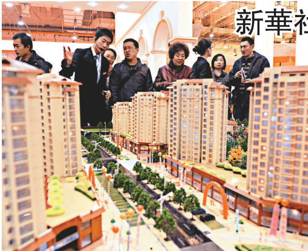
新華社連發五篇文章斥地方推高樓價。圖為眾多南京市民在房展會上看房選房

【本報訊】官方新華社一連5天發表「新華時評」，矛頭直指地方政府，痛批房地產問題的根源是地方政府「以地生財」。不過，剛舉行的長春市國有土地出讓儀式上，一幅土地又高價成交成為今年長春新「地王」。