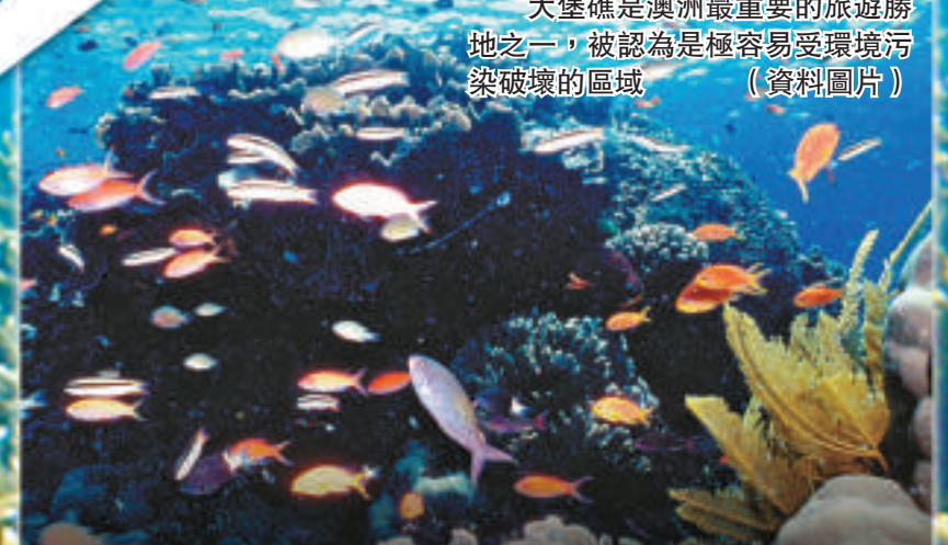
大堡礁是澳洲最重要的旅遊勝地之一，被認為是極容易受環境污染破壞的區域（資料圖片）