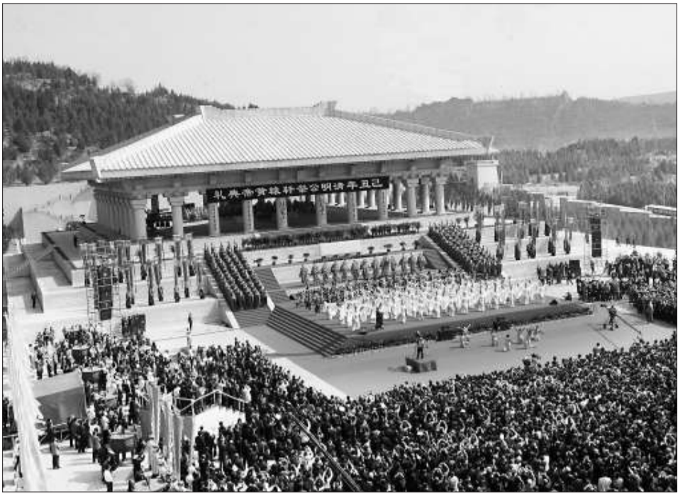
清明陝西橋山黃帝陵公祭