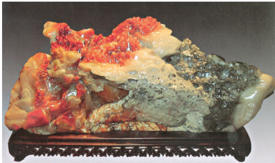
佛山盛典 水洞高山石