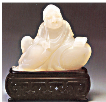
長眉羅漢 荔枝洞石