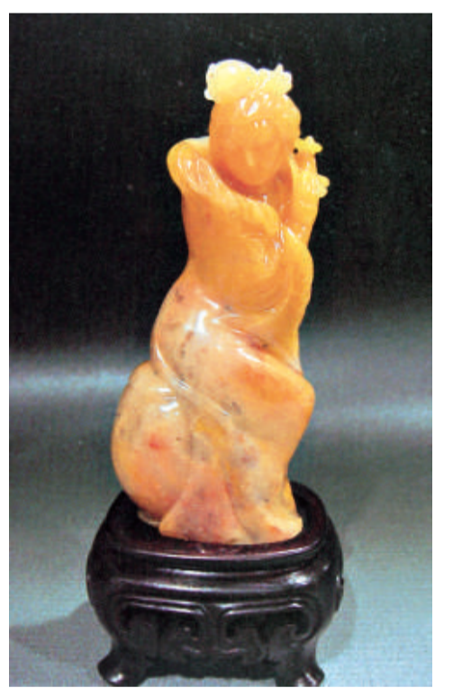
坐鼓仕女 杜陵坑石