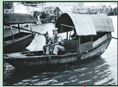
舊大澳警署資料相片