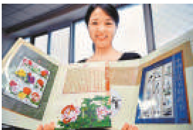
新發行的兩套印尼稅票

由此,在很長一段時間裡,集藏者對印花稅票的集藏關心度有限,一些集郵者也往往是附帶收集而已,而中國的集藏者關心印花稅票收集的更是鳳毛麟角,尤其是一些集郵者乾脆放棄稅票收藏而專心於郵票,導致我國稅票收集的水準很低。不過,這種局面在1994年得以明顯改觀,隨着中華全國集郵聯合會根據國際集郵聯的郵展規則,制定了印花稅票的參展標準,引起了不少集藏者的關注,在過去的10年間我國的印花稅票集藏發展勢頭如火如荼,一些高品質的稅票集也在國際上獲獎,成為推動印花稅票收藏的動力。