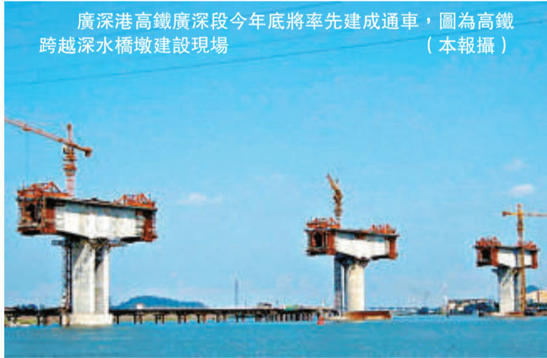
廣深港高鐵廣深段今年底將率先建成通車，圖為高鐵路越深水橋墩建設現場

消息人士說，關於廣深港高鐵廣深段、跨境段、香港段的建設與營運的研究設計，每個專題都要融合香港與內地兩套鐵路技術標準及設計規範等差異與優勢，以此將可應用於今後跨境高速鐵路和城際鐵路設計銜接工作，並結合國家鐵道部「走出去」戰略，將為今後中國高鐵技術打入世界市場提供技術支撐。