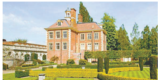
貝理雅和妻子彭雪玲位於白金漢郡郊區的17世紀大宅

【本報訊】綜合報導：英國前首相貝理雅的妻子彭雪玲日前在位於白金漢郡郊區的17世紀大宅（見圖）內為丈夫及子女準備早餐時，不慎烘焦多士冒煙，觸動屋內的火警鐘，四部消防車接報後緊急出動，到場後才知道是一場虛驚，令到彭雪玲十分尷尬。