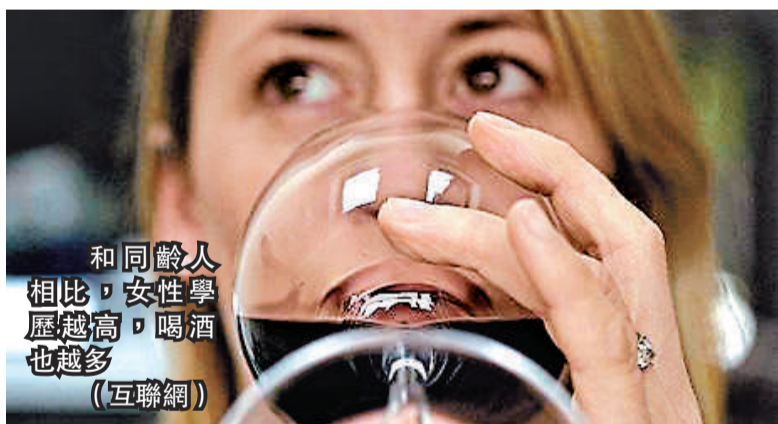
和同齡人相比，女性學歷越高，喝酒也越多

【本報訊】據英國《每日電訊報》五日消息：一項大型調查發現，和同齡人相比，女性學歷越高，喝酒也越多。持有學位的女性和學歷較低的同齡女性相比，不但每天喝酒的可能性是後者的接近兩倍，而且承認自己有酗酒問題的可能性也較大。