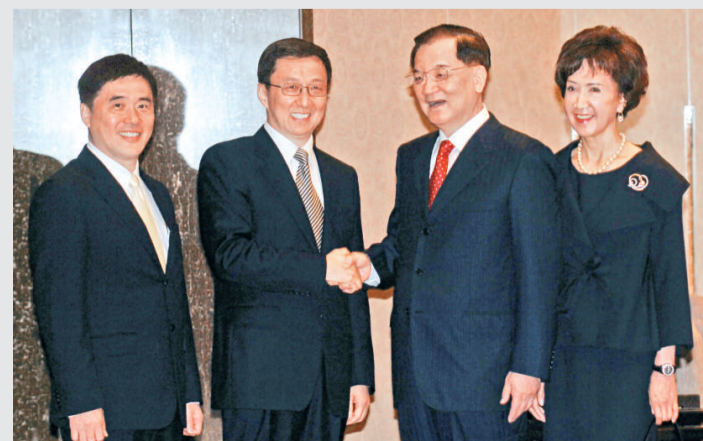
▲國民黨榮譽主席連戰(左三)昨日在台北國賓飯店會見上海市長韓正(左二),台北市長郝龍斌(左一)、連戰妻子連方瑀(左四)陪同會見

的季節,非常榮幸有重要朋友一起在台北,歡迎韓正與上海貴賓到訪,在過去幾年當中,曾經到上海訪問或路過,都承蒙韓正非常熱情的歡迎,心裡面非常感謝。連戰說,居住在上海的台灣同胞,台灣人到大陸,不論是企業、合作或唸書,已經20多萬人,多少年來,台灣的工商企業、旅遊、文化和教育等各方面的交流,都受到韓正以及上海市政府的關心與協助,他表示由衷的歡迎。連戰指出,韓正是上海最年輕的市長,也是清明、務實的市長,非常得到民心,這次為世界博覽到來,可以看到成功在望、精彩可期。上海自從改革開放以來,各方面的發展相當的驚人,將來發展的目標,不只是大陸的或區域的,而是全球的金融中心、航運中心,所以他特別邀請台灣在經濟、貿易、金融、文化、媒體和教育等各方面的業者與專家,誠摯歡迎韓正到訪。