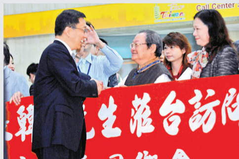
▲韓正(前)昨日抵達台北松山機場時,受到歡迎他的上海同鄉會民眾歡迎

韓正說,上海也非常鼓勵和支持浦東發展銀行,盡早到台北開設辦事處。這些重大舉措,定會進一步推動兩岸經貿往來。韓正還表示,這次搭機從上海虹橋機場到松山機場,飛了80分鐘,比他想像中的要快。「我們正在積極推進虹橋機場和松山機場的直航」。國民黨榮譽主席連戰下午在台北國賓飯店會見上海市長韓正,感謝他過去多年以來,多次以地主的身份接待。韓正還在台北市長郝龍斌陪同下,專程來到台灣百年名校——中山女高,與老師同學們見面、對話。據台北市政府和上海市方面發布的行程,4天3夜、共計80小時的時間裡,韓正還將觀賞上海交響樂團演出,出席上海資金入島說明會,會見台灣重量級企業家,拜會台灣海基會,除了與連戰會見外,還將分別與吳伯雄、辜慶儀等知名人士會面,參觀台北故宮、誠品書店、北投焚化場、101大樓、振興醫院,體驗台北捷運等。還將赴台北縣、台中市、桃園縣參訪,期間與宋楚瑜、周錫瑋、胡志強、吳志揚見面。