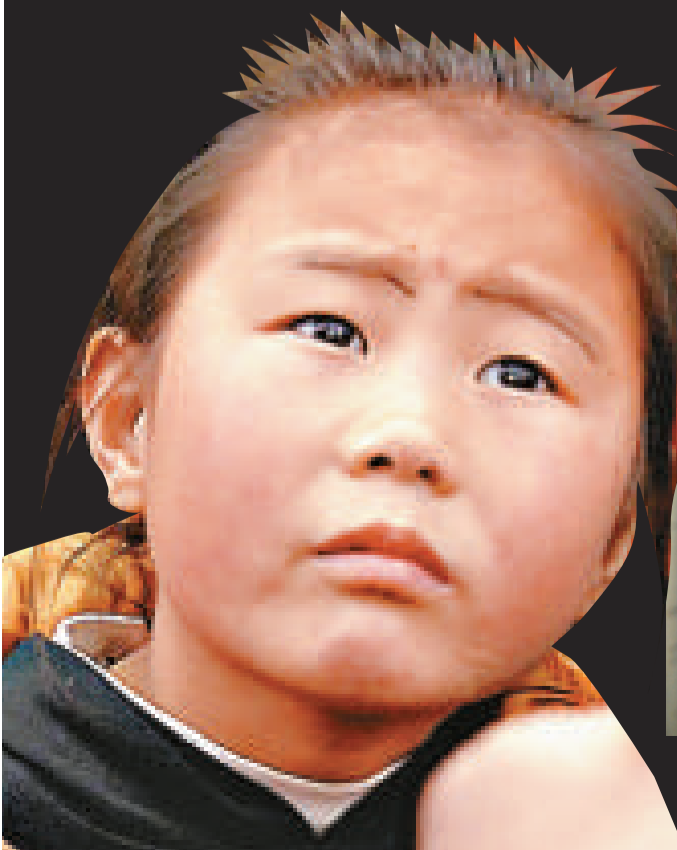
被困礦工家屬在現場守候