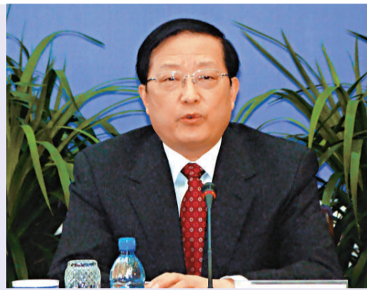
▲遼寧省省長陳政高出席新聞發布會 (本報攝) ▲瀋陽經濟區獲批國家新型工業化綜合配套改革試驗區新聞發布會 (本報攝)