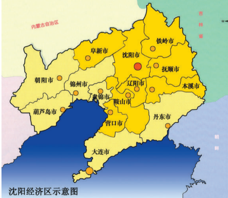
瀋陽經濟區示意圖

遼寧省長陳政高表示，八城市要實現八個一體化，即交通一體化、通信一體化、生產要素一體化、市場一體化、戶籍一體化、就業和社會保障一體化、基礎設施和公用設施一體化、生態環保方面的一體化。