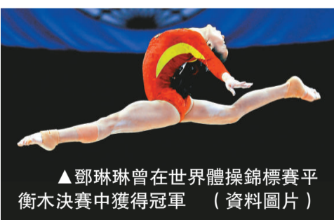
▲鄧琳琳曾在世界體操錦標賽平衡木決賽中獲得冠軍（資料圖片）

本次比賽4月6日開幕，將於4月9日結束，設有14個項目，共有19支隊伍的183名運動員參賽。