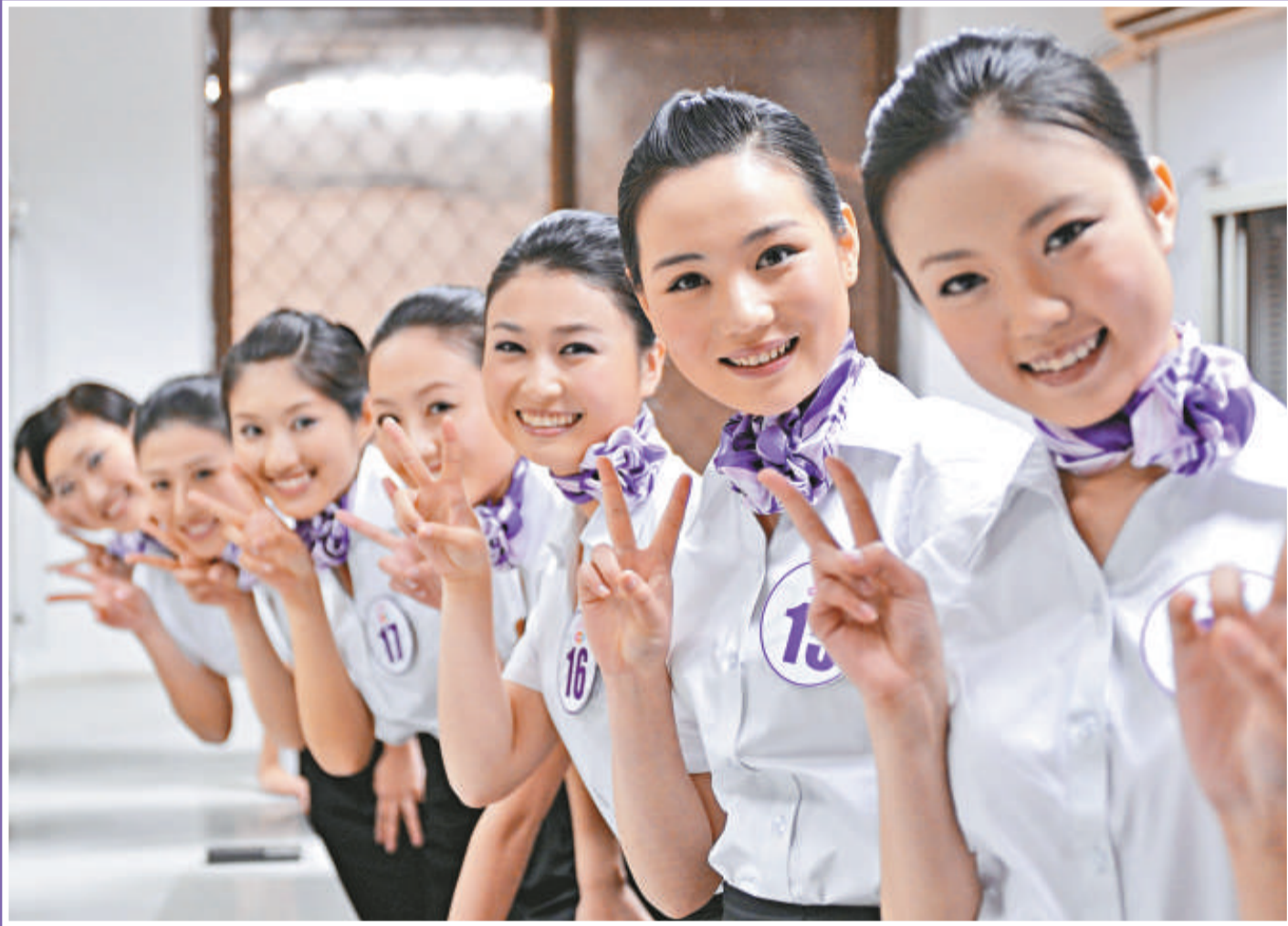
「空姐新人秀」昨天在武漢進行最後角逐。圖為選手們在緊張等候出場時不忘展露美麗的笑容

來自湖北宜昌的8號選手說：「南航空姐招聘各選區都沒有規定具體的招募人數，今天的電視晉級賽只要表現優秀皆可順利晉級，一路篩選下來，大家都成了好朋友，希望彼此放鬆拿出最好的狀態圓自己的空姐夢。」