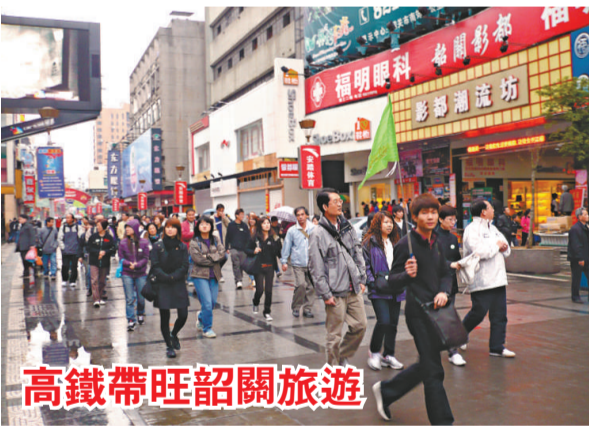
高鐵路帶旺韶關旅遊

作為特事特辦，邊檢站立即與山西省旅遊局取得聯繫，並派出民警開足所有通道，與安檢部門、航空公司進行溝通，做好充分準備。在距離航班起飛前十分鐘，邊檢機關接到了山西省旅遊局委託兩名旅客擔任領隊的文件，全體成員終可登上飛機順利成行。