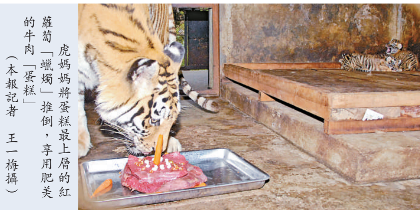
虎媽媽將蛋糕最上層的紅蘿蔔「蠟燭」推倒，享用肥美的牛肉「蛋糕」

上午11時30分許，動物大廚鍾蘭清師傅親自為虎媽媽做起了滿月「蛋糕」。這個特製的「蛋糕」足足用了7.5公斤精牛肉，五層牛肉疊起的「蛋糕」上面還用六根紅蘿蔔條充當「蠟燭」。最重要的是，這肥美的精牛肉裡還添了由愛心企業深圳市