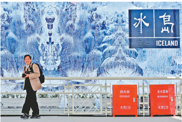
具特色 世博的冰島館

【本報記者劉文傑上海八日電】由一公斤黃金鑄成的上海世博會特許商品「盛世虎印」7日晚在滬面世，每方售價高達人民幣36萬元。「盛世虎印」由一公斤純黃金鑄成，全球限量2010方。金虎造型虎爪前伸、雙耳上翹、目視前方、威風凜凜，大有騰躍千里之勢。虎印底座長71毫米、寬67毫米、高90.5毫米，兩側刻有中國傳統吉祥回紋和2010年上海世博會會徽，正面刻篆字銘文，背面刻中英文對照字樣。