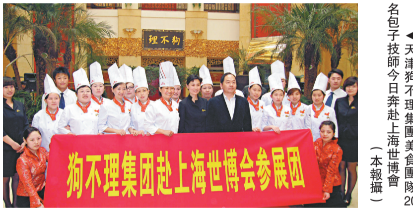
名包子技師今日奔赴上海世博會

號品牌。「狗不理」肩負着天津市1300萬人的重託，為了保證狗不理包子原汁原味，狗不理包子將在世博會上現場和麵、調餡、包製，現蒸現吃。根據中外賓客的飲食習俗，狗不理包子供應品類為傳統豬肉包、牛肉包，工作人員將分兩班工作，日產包子1萬多個，營養全面，美味可口，就餐快捷，享譽世界。狗不理是代表天津唯一參加世博會中華美食街展銷的百年老字