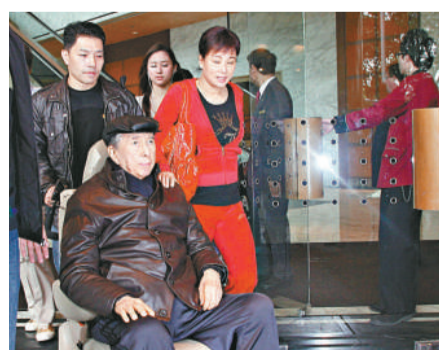
賭王精神甚佳由三太太陳婉珍陪同到酒店午膳

昨日是賭王何鴻燊與三太太陳婉珍結婚三十三周年的日子，昨日賭王坐着輪椅與三太太一家到灣仔一間酒店午膳慶祝。但見賭王精神不俗，對記者提問亦有作簡短回答，記者問他是否愛足三太太一百年？他說：「希望。（最愛她？）是！（你還想去什麼地方？）我想返鄉下。（是澳門嗎？）是！」午膳之後除了超運之外，其他人便一齊回大宅。