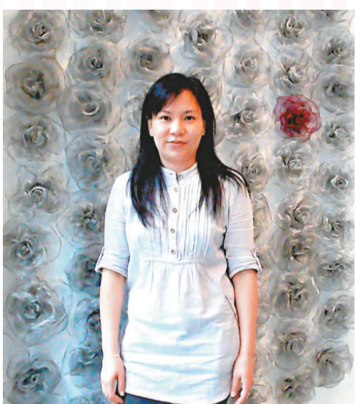
Violet 這組《70 乘 7》首次將其中一朵玫瑰以丙烯畫上紅色（本報攝）

Violet 大部分的玫瑰都是不鏽鋼原色，但作品《70 乘 7》，則是在眾多不鏽鋼玫瑰中，亮出一朵優雅的深紅色玫瑰，Violet 說，這是與聖經伯多祿的故事有關，意思是原諒人七次