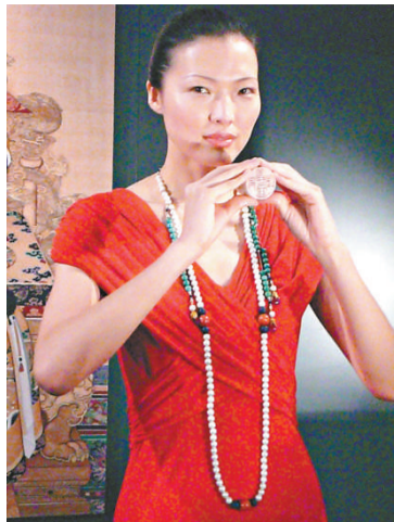
模特兒戴上成交價六千七百多萬的御製東珠朝珠，並展示白玉圓璽

【本報訊】記者洪捷報導：昨日是蘇富比春季拍賣壓軸的一天，舉行了「水松石山房藏珍玩專場」及「中國瓷器及工藝品」兩個部分，買家們競投相當活躍，不少御製工藝品被搶至超過估價數倍甚至十倍成交。當然也有破紀錄的成交價，其中清乾隆帝御寶題詩「太上皇帝」白玉圓璽以九千五百八十六萬元成交，刷新御製玉璽拍賣的世界紀錄兼白玉拍賣的世界紀錄，昨日全日總成交額亦高達十九億九千多萬元。