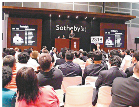
舉着2318號牌的買家相當活躍，購得九千多萬元的乾隆「太上皇帝」白玉圓璽

昨日其他高價成交的拍品還有清乾隆朝胎畫北京珠琅「富貴萬壽」圖三層提匣，以二千七百五十四萬元成交，打破北京珠琅器拍賣紀錄；清乾隆御製竹黃御製詩「九如靈芝」圖如意，以一千五百七十八萬元打破竹雕拍賣紀錄及如意拍賣紀錄。