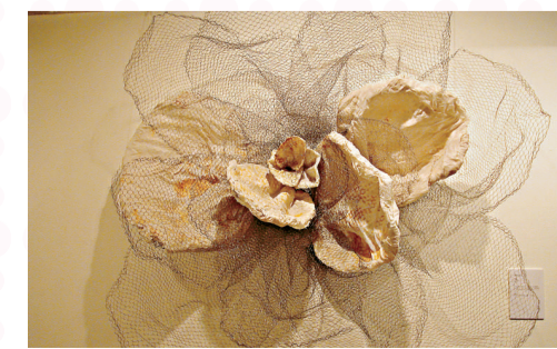
Violet 第一件立體玫瑰花裝置，用鐵線織成