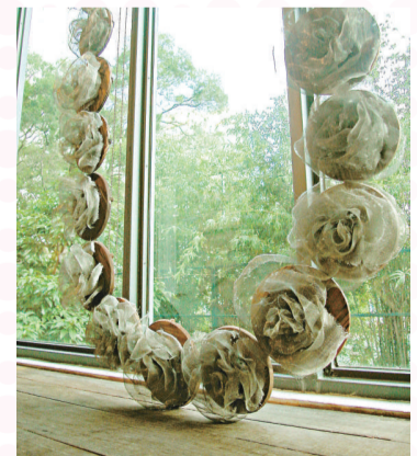
▲用玫瑰花串成的珠鍊背後隱含宗教意義 ▶《玫瑰花雨》由聖經中故事人物取得靈感，表達 Violet 對人們的祝福

Violet 看起來年輕清純，卻有一顆愛深思的心，她自幼已在愛這個題目上不斷探索，並且由創作的初時，已嘗試借玫瑰說話。「這個展覽是『Thorns and Roses』（痛苦與快樂）」，也就是玫瑰花與刺，玫瑰代表快樂，刺則是痛苦，這亦是愛的正反兩面。我由學習藝術開始，已一心探究用怎樣的方法，去表達玫瑰花象徵意義——愛。」