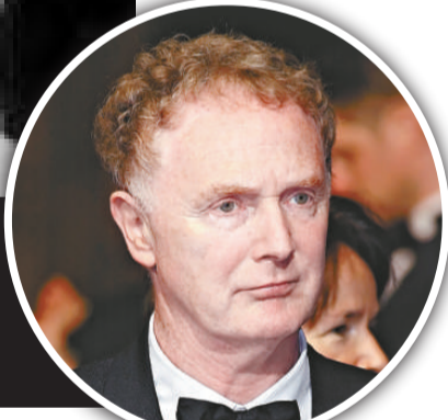
▼崩樂時代重要人物麥克拉倫因癌症逝世