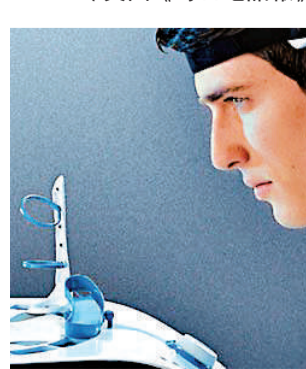
▲「腦波玩具」的玩家戴上腦波偵測器，憑藉腦中念力，就能移動海綿球

拿來訓練兒童的專注力。它內建5種難度不同的玩法，還有對戰模式，有了這些玩具，人人都能展現超能力。「腦波玩具」由美國玩具大廠研發，曾被《家長》雜誌選為2009年最佳玩具。「腦波玩具」將於夏天在英國上市，售價80英鎊。（英國《每日電訊報》）