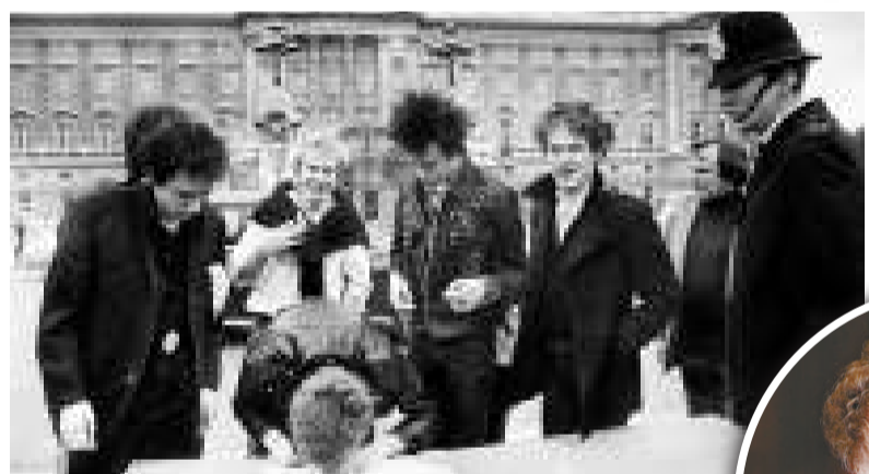
Sex Pistols 樂隊高調地在英國白金漢宮前簽約