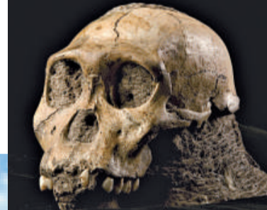
►南方古猿的骸骨 ▼南方古猿的發現地馬拉帕洞，是被聯合國列為世界遺產地點的「人類搖籃」

這項發現引發了科學界和考古學界激烈爭議。有專家質疑，「南方古猿源泉種」只不過是「生於錯誤地點、錯誤時間的錯誤物種」，因為他太原始，不可能是人類的直系祖先。（綜合報導）