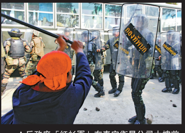
▲反政府「紅衫軍」在泰空衛星公司大樓前與軍警發生衝突