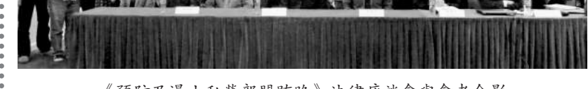
《預防及遏止私營部門賄賂》法律座談會與會者合影