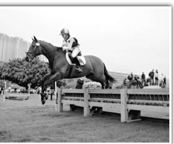
今年的「香港馬術馬王賽」吸引近一百名騎手及馬匹參加

參加者須憑券入場。持票者可乘搭專巴，分別在沙田港鐵站或粉嶺港鐵站（A出口），前往彭福公園或上水雙魚河鄉村會所。市民可於即日起，在康樂及文化事務處各分區康樂事務辦事處免費索取入場券。數量有限，先到先得，送完即止。