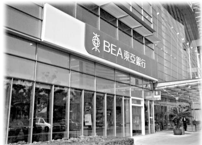
「東亞中國」蘇州分行

東亞銀行宣布其全資附屬公司—東亞銀行（中國）有限公司（「東亞中國」）將蘇州代表處升格為一家提供全面銀行服務的分行，蘇州分行已正式投入服務。