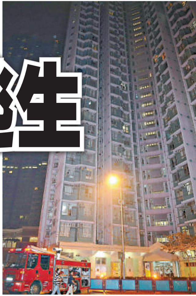
▲發生抽濕機火警的將軍澳健明邨

消防員在梯間拉喉射水灌救，約二十分鐘將火撲熄；起火的抽濕機嚴重焚毀，只燒剩內部鐵製機件，走廊牆壁熏黑。消防員調查後相信抽濕機電線短路起火，火警無可疑，幸無人受傷。居民稍後陸續返回住所。