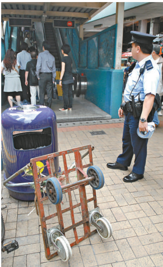
▲引致兩男女仆傷的手推車

警員在死者身上發現銀包確實了身份，聯絡其家人到醫院認屍。由於他有母親妻女，雖然身體有病，慈母形容他早上返工時還「好好地」，而墮海地點鄰近其返工地盤，未知是否意外墮海，現列屍體發現案處理，警方仍在調查墮海原因。