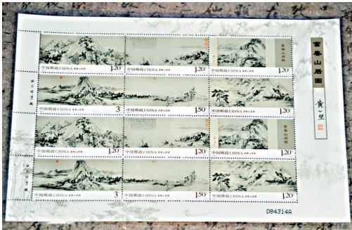
▲早前國家郵政局發行的《富春山居圖》特種郵票

然而經歷明末清初改朝換代的戰亂後，吳氏大部分珍藏早已散失，唯獨隨身帶了黃公望的《富春山居圖》和智永法師的《千字文》逃難。後來吳洪裕病重，囑託家人將這兩卷畫交付之一炬陪葬。《千字文》先被焚毀，及至焚燒《富春山居圖》之際，吳洪裕侄兒眼見吳已氣絕，心中不忍這幅曠世名畫就此化為灰燼，立即將長卷從火堆中搶救出來，但部分已慘遭焚毀，並斷裂成大小兩段，其中較小的一段恰有一山一水一丘一壑，遂獨立裝裱成「剩山圖」部分；另一幅較長的由於損毀嚴重，火燒痕迹較