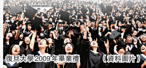
復旦大學2009年畢業禮