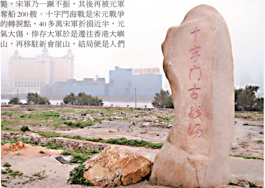
▲十字門古戰場只有指示大石，並無遺物