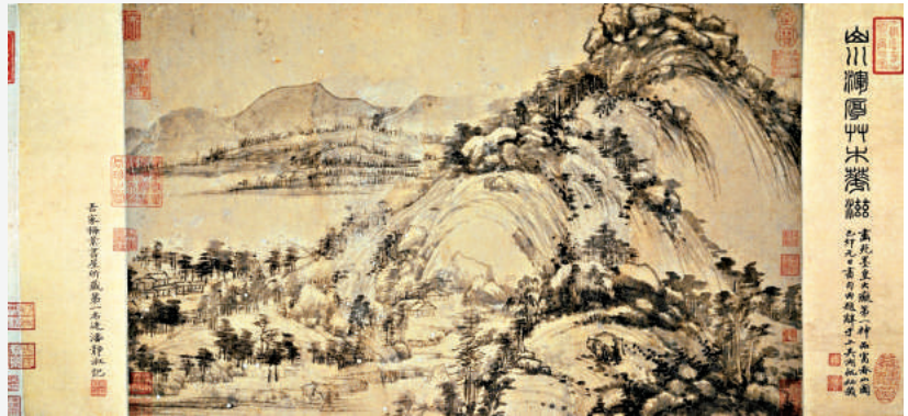
▲《富春山居圖》的「剩山圖」部分，現藏浙江省博物館