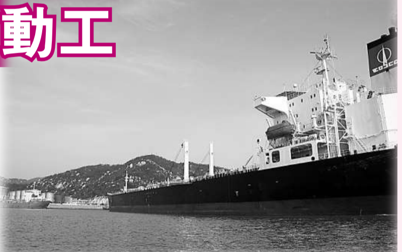
珠海桂山島上將建成華南沿海最大的專業成品油碼頭。圖為珠海港碼頭

該項目每年將新增 105 萬噸吞吐能力，為多點繫泊改造期間船舶卸貨生產提供接替能力。 「珠海中燃」表示，由於片區業務的快速發展和安全生产需要，「中燃」總部已計劃投資 2.38 億元人民幣，啓動「珠海中燃」桂山油庫二期「珠海中燃」桂山油庫多點繫泊碼頭技術改造工程」的發展工作，其主體工