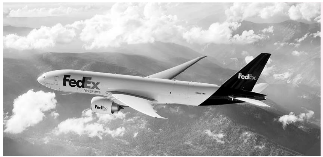
波音 777 型貨機首次被用於香港貨運航線，聯邦快遞現正籌劃將該機型投放於歐洲直航線

安克雷奇轉運中心，現時其中 6 班直航至孟菲斯超級空運中心，並全數轉用 777 長程型貨機，可藉此延長截件時間。通過旗下「國際優先遞送服務」和「國際經濟遞送服務」，由本港寄件至美國東岸的截件時間獲延長達 2 小時。