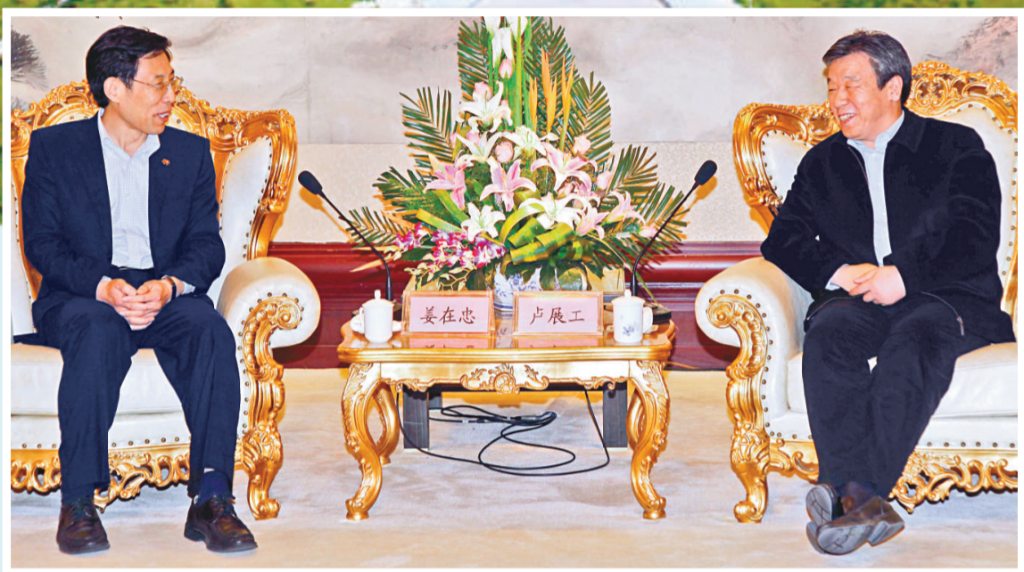
◀河南省委書記盧展工(右)會見大公報董事長、社長姜在忠(左)

4月13日上午，河南省委書記盧展工與大公報社長姜在忠在河南省會鄭州索菲特國際酒店，共同為大公報中原新聞中心成立授牌。該新聞中心是大公報繼北京、上海、廣州、深圳、海西、南亞之後，在中國內地設立的第七個新聞中心。