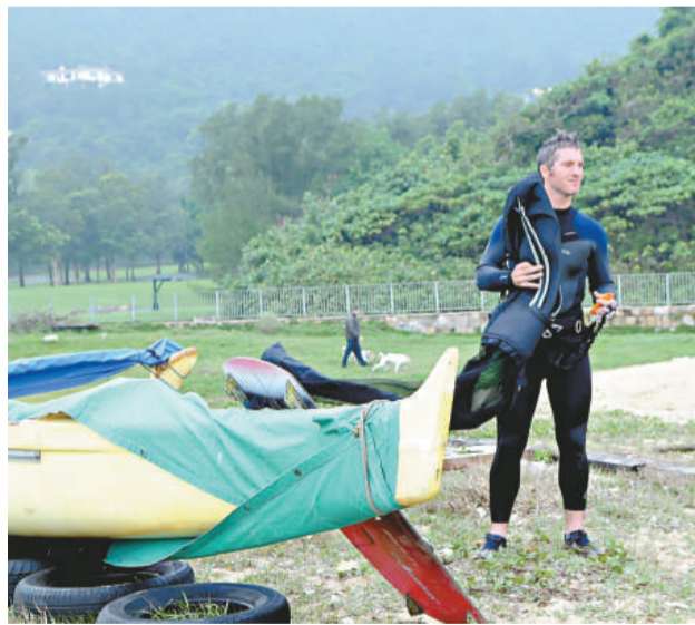
▲惹過溺驚魂的法籍男子