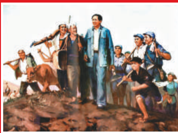
▲1943年冬，毛澤東在南泥灣視察八路軍炮兵團（網絡圖畫）

延安市市長陳強表示，由「三五九旅」的後代們來開發建設南泥灣，是經過延安市委、市政府慎重研究後的最佳選擇。「三五九旅」的後代們已在南泥灣實地考察了三個多月，已經形成了操作性很強的規劃方案，合同簽訂後，將很快進入項目實施階段。