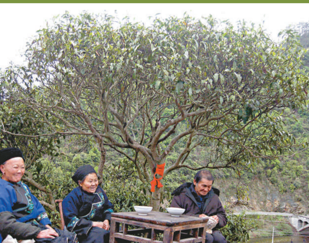
湖南湘西保靖縣黃金寨古茶園中的一棵「黃金茶樹王」樹齡有402年，極為罕見

【本報訊】中新社湘西14日消息：湖南湘西保靖黃金寨古茶園中的一棵「黃金茶樹王」今天被專家證實，樹齡高達402年。尤其令人稱奇的是，該樹目前仍年產上等毛尖500餘克。