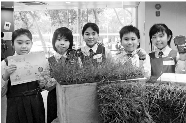
風溪第一小學代表隊奪得評判大獎

【本報訊】不少人上了小巴方知無座位而感尷尬。香港聖母無玷聖心學校的五名小學生發揮無限創意，將壓力感應器安裝在小巴座位底，並將與座位相同數量的指示燈置於司機視野範圍內，如座位被佔據指示燈會自動亮起，哪些座位有人無人，司機一目了然。香港聖母無玷聖心學校憑藉此套成本僅五十元的探究發明，勇奪第十三屆「常識百搭」科學專題探究展覽「我最喜愛的專題研究獎」和「優異獎」。