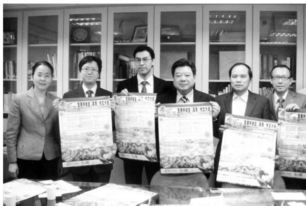
「學苑杯」全港中學生「真情」作文比賽昨舉行簡介會