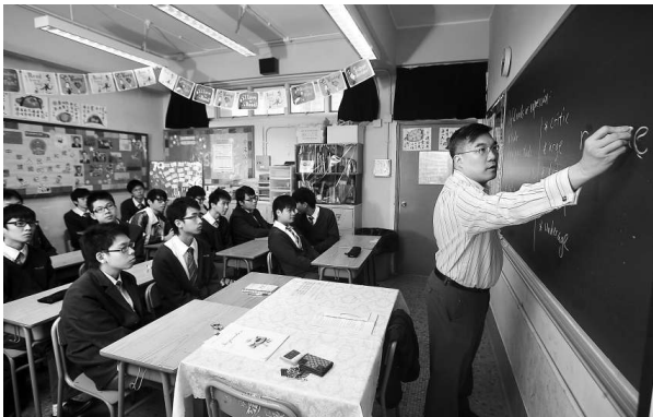
教育局公布有逾一萬五千名學位教師擔任非學位教席（資料圖片）

有興趣參賽的學校可瀏覽 http://www.yuenyuen.org.hk/ ； http://www.baumag.com.hk 。