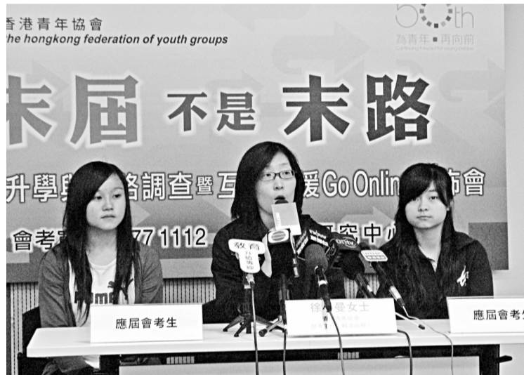
香港青年協會 The Hong Kong Federation of Youth Groups

【本報訊】實習記者吳瑤報導：一項調查顯示，末屆中學會考生壓力奇高。香港青年協會新一項調查顯示，約六成受訪考生的壓力偏高，較去年上升一成半，近七成考生擔心若只能達到中五程度，會比不上新高中的畢業生。青協今年三月對全港三十二間中學一千五百多名應屆